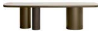
CILINDRO MIX pag. 62