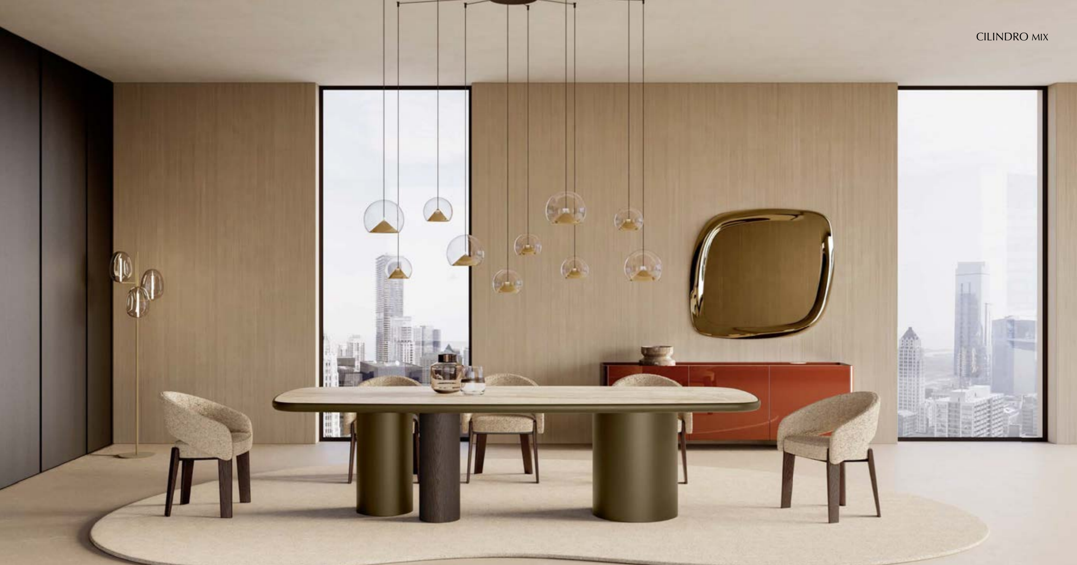
CILINDRO MIX_top ceramica King tavolo, cm 303x123 sagomato, base: verniciato bronzo, frassino testa di moro, piano: ceramica Silver Root bianco, bordo: verniciato bronzo. FUR poltroncina, gambe: frassino testa di moro, tessuto B 292 · CHERRY MIX_10 sospensione lampada, oro spazzolato. ALMA madia, cm 220x45x h 75, laccato Mattone lucido · ASTRUM specchio cm 132x120, bronzo specchiato lucido · FOS_terra lampada, oro spazzolato.