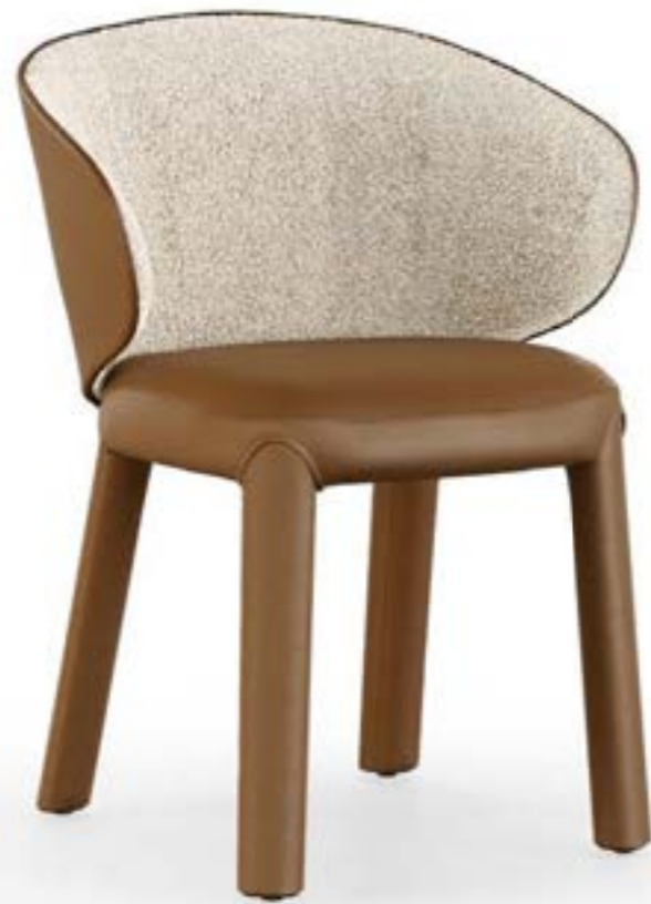
GUJA arm poltroncina, schienale interno: tessuto A 432, gambe e schienale esterno: pelle 4234 tabacco chiaro.

GUJA arm armchair, internal back: fabric A 432, legs and external back: leather 4234 tabacco chiaro.