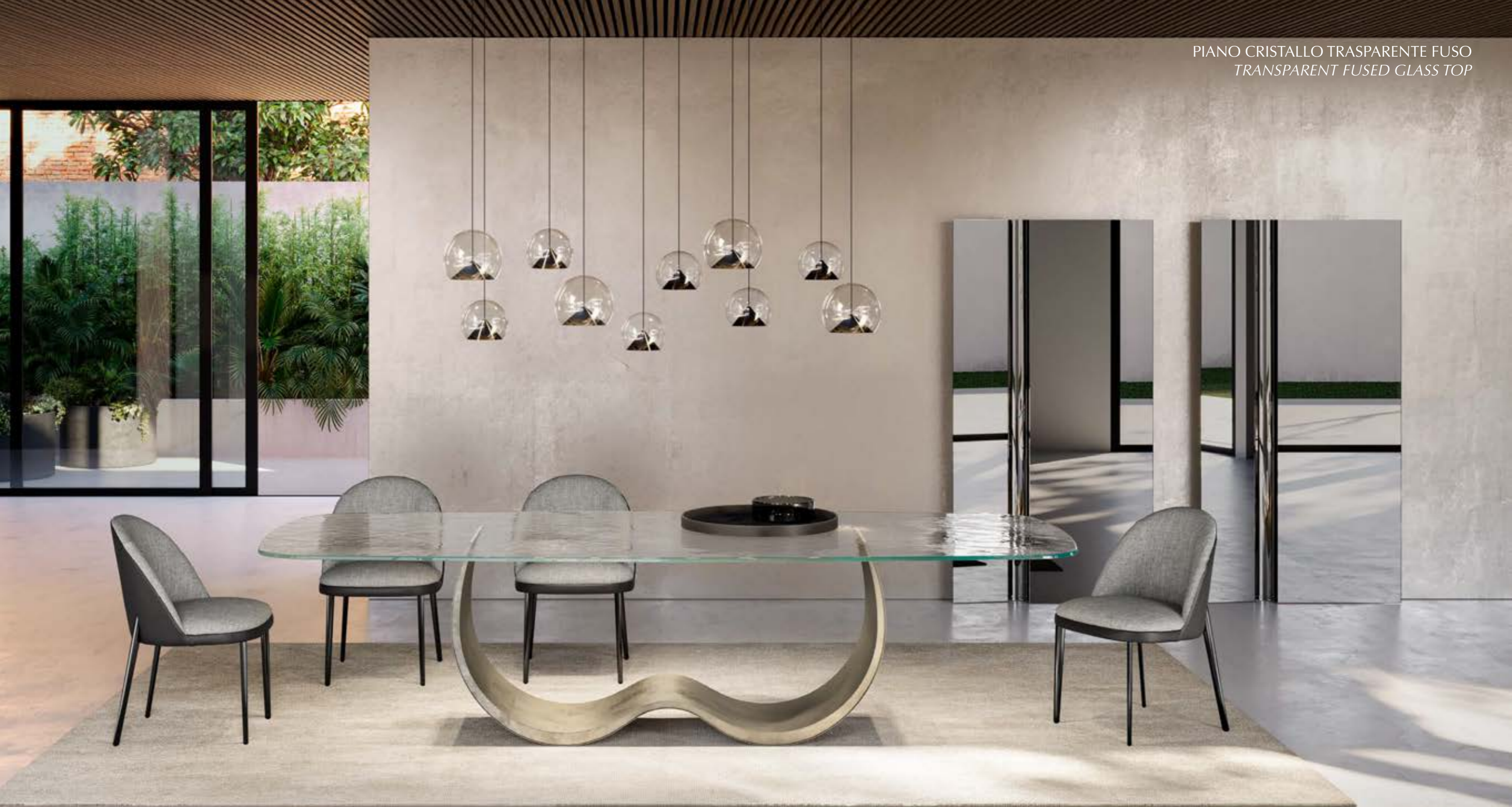
ALISEI_top cristallo tavolo, cm 300x120 sagomato, base: platino spazzolato, piano: cristallo extrachiario trasparente. MINNI_4 gambe metallo poltroncina, gambe: cromato nero, seduta: tessuto A 204, schienale: pelle Elite E42 elefante. CHERRY MIX_10 sospensione lampada, verniciato nero · LET specchio, cm 104x198, cristallo specchiato fumè.