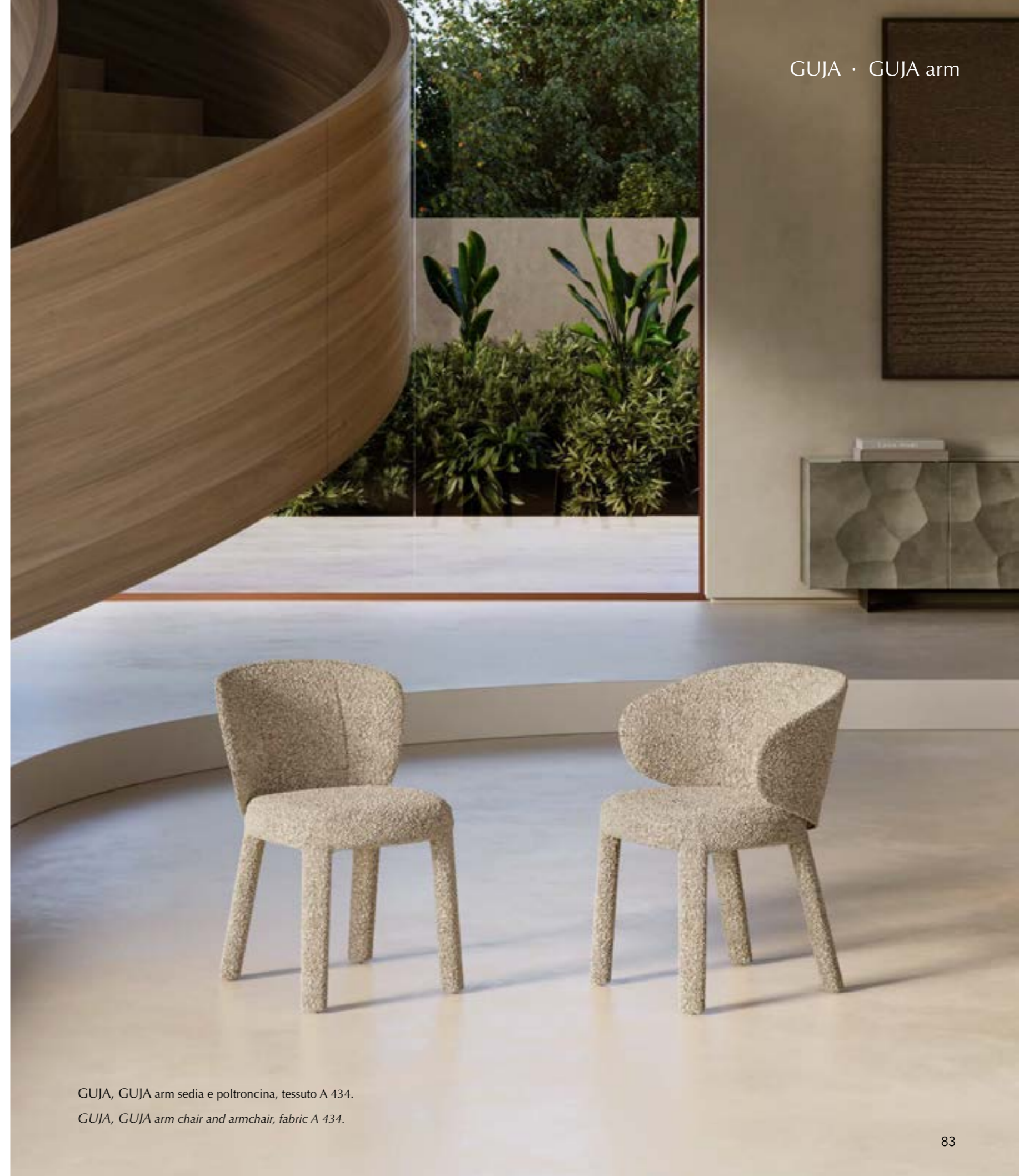
GUJA, GUJA arm sedia e poltroncina, tessuto A 434.

The Guja chair is a piece of furniture with a sculptural and textural design, defined by solid volumes and soft geometries: a distinctive piece capable of conferring a strong personality and refined style to any living space. The result of innovative formal studies, the Guja collection stands out for its monolithic aesthetics, where the robust legs blend harmoniously with the seat. The collection, consisting of a chair and an armchair, is characterised by a fully upholstered structure that enhances the continuity of the surfaces. The contrast between the curved, inviting lines of the backrest and the geometric solidity of the base creates a clean, rigorous design with great visual impact. Available in leather, eco-leather or fabric.