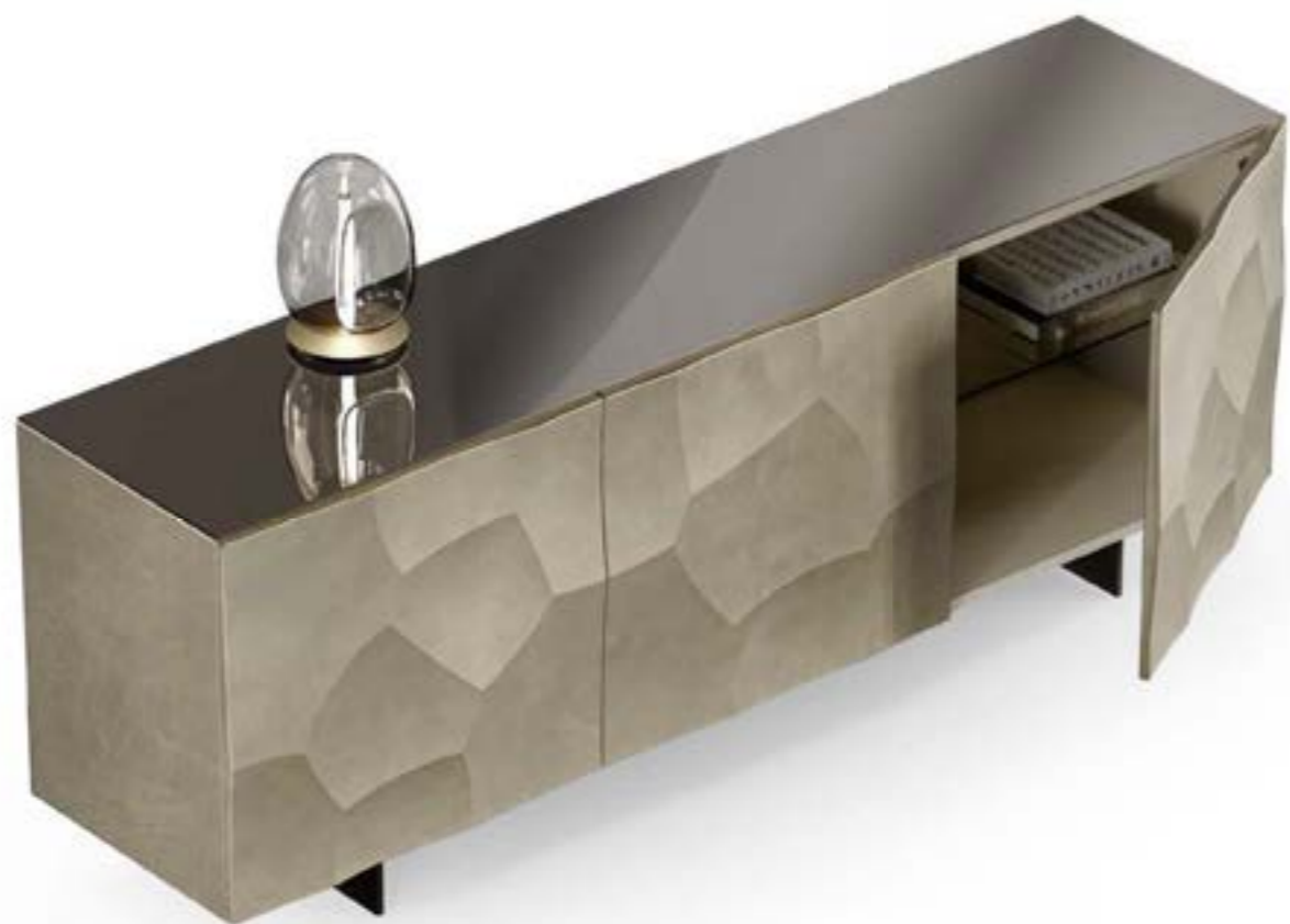
GRETA madia, versione A, cm 200x48x h 73, platino spazzolato, top: cristallo specchiato fumè. FOS_tavolo lampada, verniciato titanio.