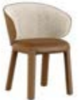
GUJA arm pag. 82