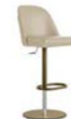
MANTA STOOL base girevole / swivel base pag. 142