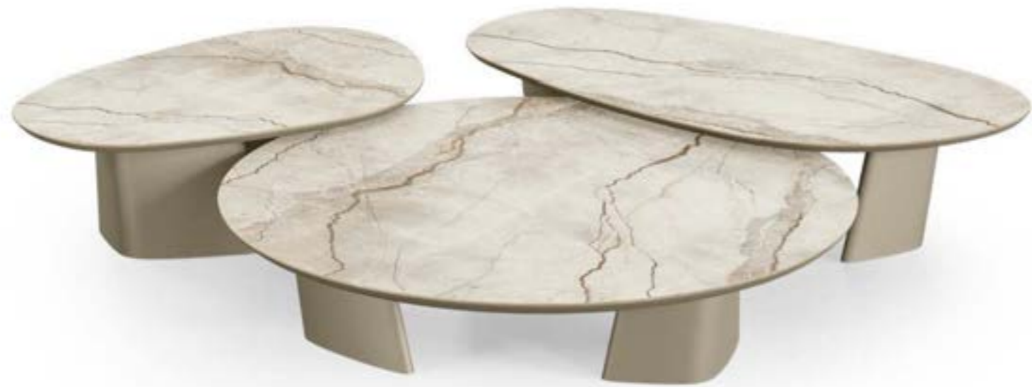
ACHILLE LOW_top ceramica Prime tavolino, Ø cm 160x h 33, base: verniciato titanio, piano: ceramica Silver Root bianco opaco. ACHILLE LOW_top ceramica Prime tavolino, cm 160x84x h 38,5 stone, base: verniciato titanio, piano: ceramica Silver Root bianco opaco. ACHILLE LOW_top ceramica Prime tavolino, cm 119x79x h 38,5, base: verniciato titanio, piano: ceramica Silver Root bianco opaco.

ACHILLE LOW_ceramic top Prime coffee table, Ø cm 160x h 33, base: titanium painted, top: matt ceramic Silver Root bianco. ACHILLE LOW_ceramic top Prime coffee table, cm 160x84x h 38,5 stone, base: matt ceramic Silver Root bianco. ACHILLE LOW_ceramic top Prime coffee table, cm 119x79x h 38,5, base: matt ceramic Silver Root bianco.