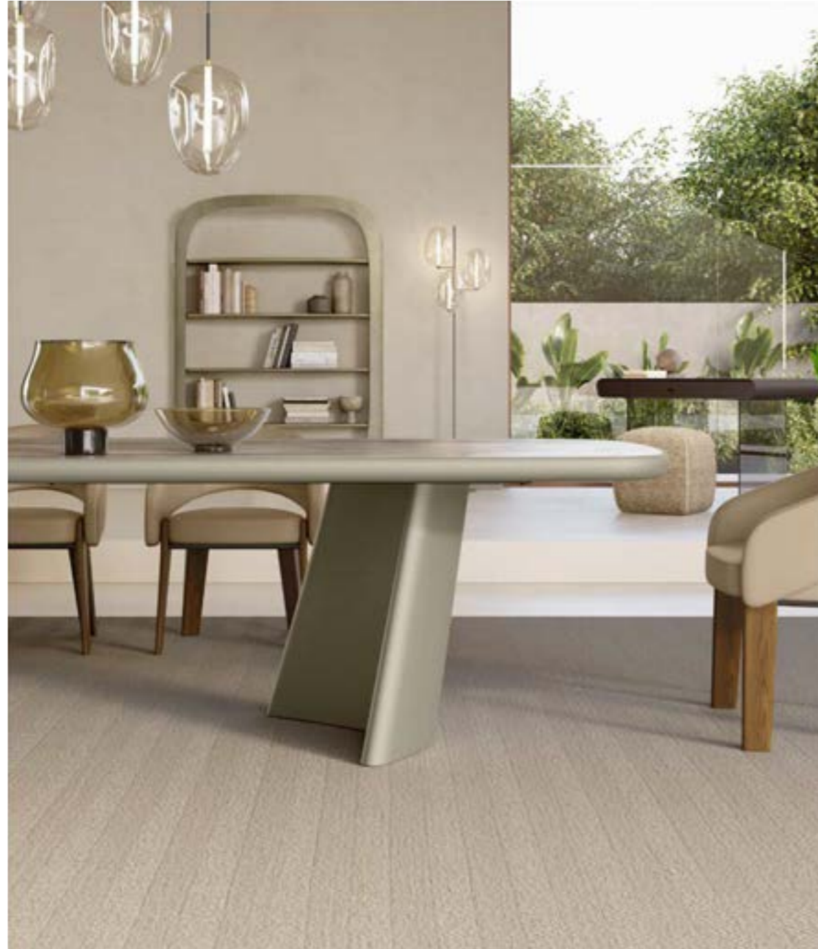
ACHILLE_top ceramica King tavolo, cm 303x123 sagomato, base: verniciato titanio, piano: ceramica Silver Root opaco, bordo: verniciato titanio · FUR poltroncina, gambe: noce Canaletto, pelle Elite E04 argilla · FOS_7 sospensione lampada. POLIFEMO LIBRERIA, cm 139x35x h194, platino spazzolato · BICE DESK scrittoio, base: cristallo fumé trasparente, piano: pelle 5270 testa di moro · NICO pouf, cm 48x48x h 49, tessuto B 292.