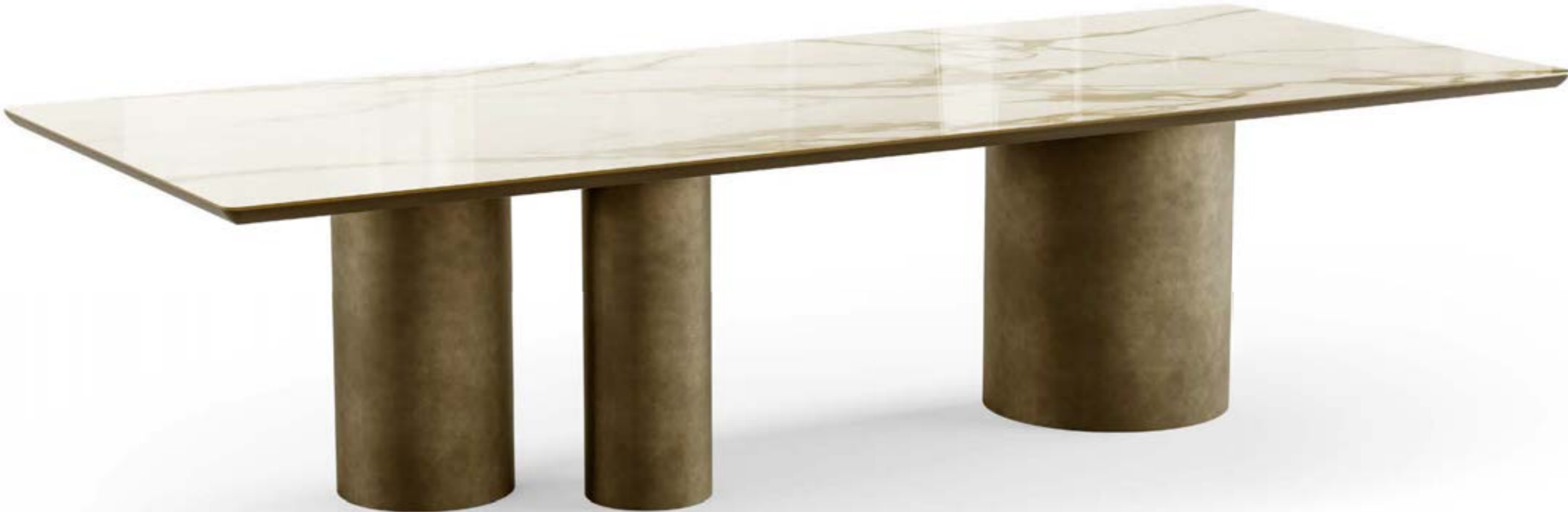
CILINDRO MIX_top ceramica Prime tavolo, cm 300x120, base: bronzo spazzolato vintage, piano: ceramica Calacatta Macchia vecchia lucido.