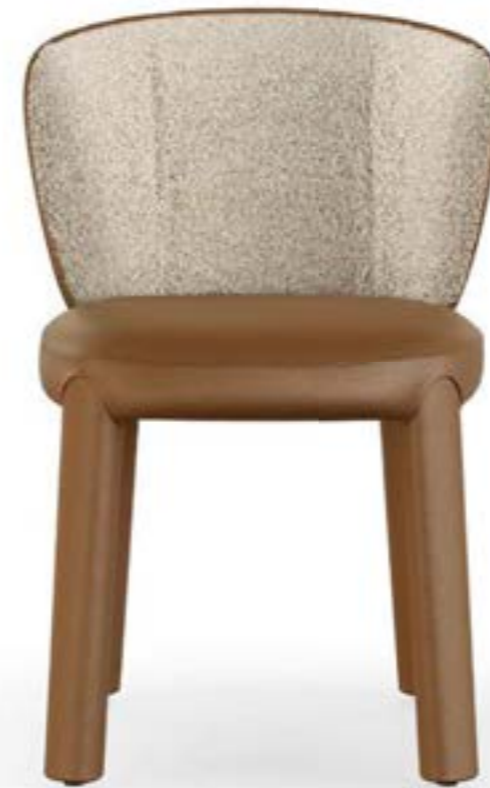
GUJA sedia, schienale interno: tessuto A 432, gambe e schienale esterno: pelle 4234 tabacco chiaro.

GUJA arm armchair, internal back: fabric A 432, legs and external back: leather 4234 tabacco chiaro.