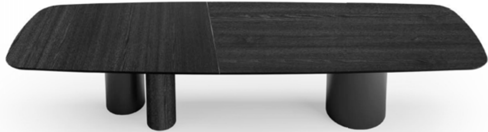
CILINDRO MIX_top legno XL tavolo, cm 400x120 sagomato, base: verniciato nero, frassino nero, piano: frassino nero. GUJA, GUJA arm sedia e poltroncina, schienale interno: tessuto B 291, gambe e schienale esterno: pelle 9034 creta. FOS_8 sospensione lampada · NINFA madia, cm 200x48x h 74, laccato Ottanio lucido · FOS_tavolo lampada, verniciato titanio.