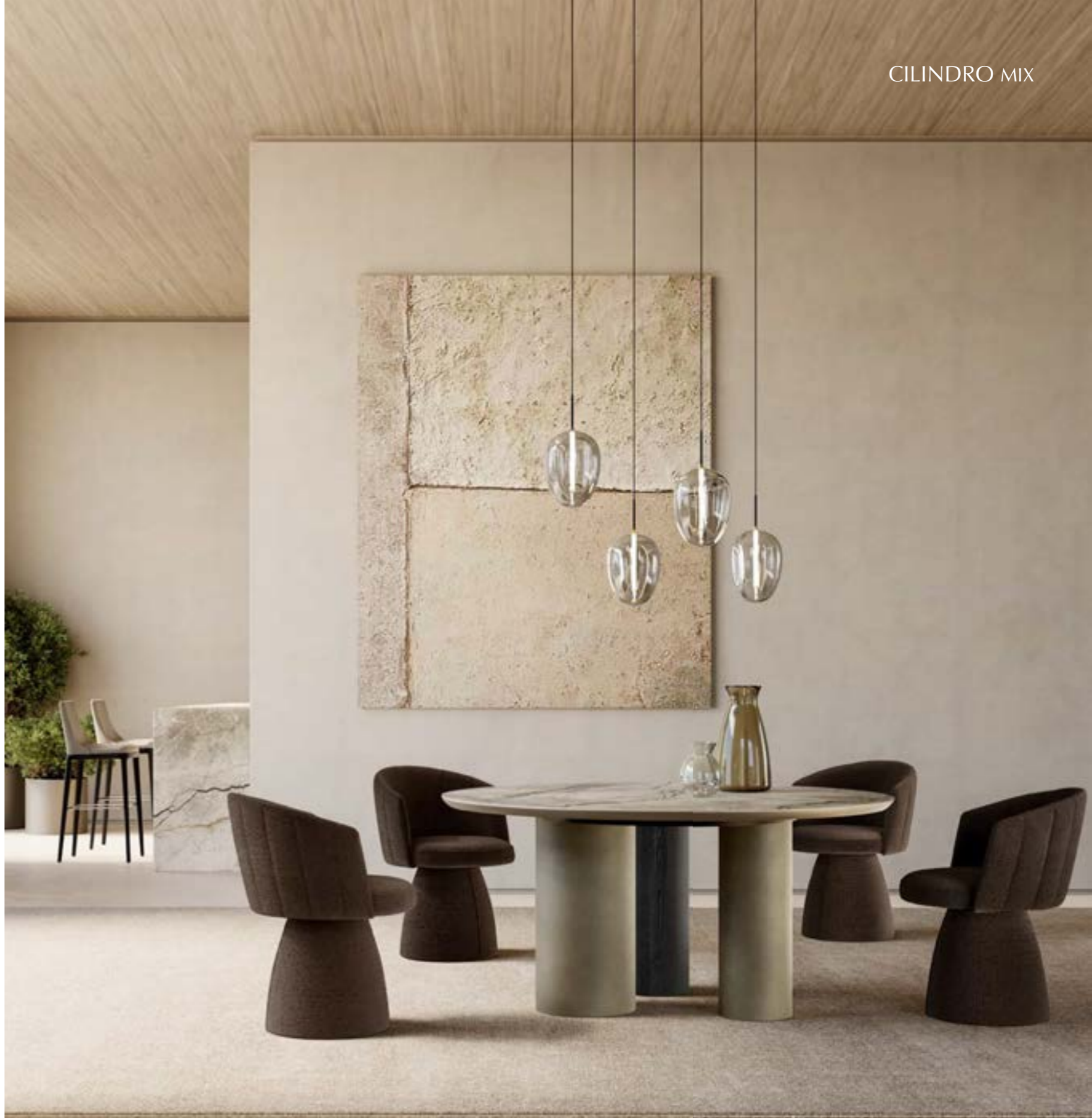
CILINDRO MIX_top ceramica Prime tavolo, cm Ø 160, base: platino spazzolato, frassino nero, piano: ceramica Silver Root opaco. JANE PRESTIGE poltroncina, tessuto B 284 · FOS_4 sospensione lampada.