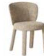
GUJA pag. 82