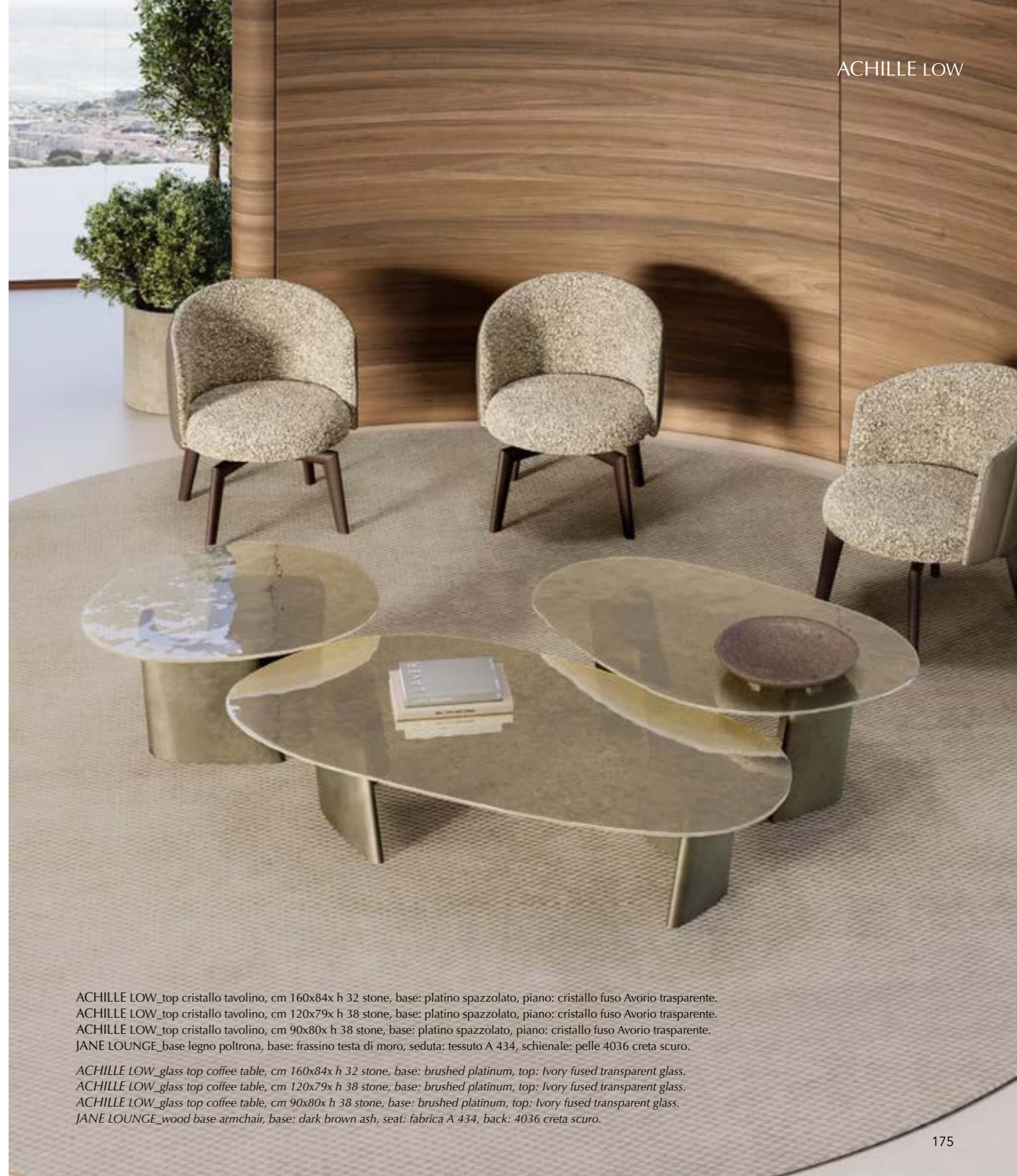
ACHILLE LOW_top cristallo tavolino, cm 160x84x h 32 stone, base: platino spazzolato, piano: cristallo fuso Avorio trasparente. ACHILLE LOW_top cristallo tavolino, cm 120x79x h 38 stone, base: platino spazzolato, piano: cristallo fuso Avorio trasparente. ACHILLE LOW_top cristallo tavolino, cm 90x80x h 38 stone, base: platino spazzolato, piano: cristallo fuso Avorio trasparente. JANE LOUNGE_base legno poltrona, base: frassino testa di moro, seduta: tessuto A 434, schienale: pelle 4036 creta scuro. ACHILLE LOW_glass top coffee table, cm 160x84x h 32 stone, base: brushed platinum, top: Ivory fused transparent glass. ACHILLE LOW_glass top coffee table, cm 120x79x h 38 stone, base: brushed platinum, top: Ivory fused transparent glass. ACHILLE LOW_glass top coffee table, cm 90x80x h 38 stone, base: brushed platinum, top: Ivory fused transparent glass. JANE LOUNGE_wood base armchair, base: dark brown ash, seat: fabrica A 434, back: 4036 creta scuro.