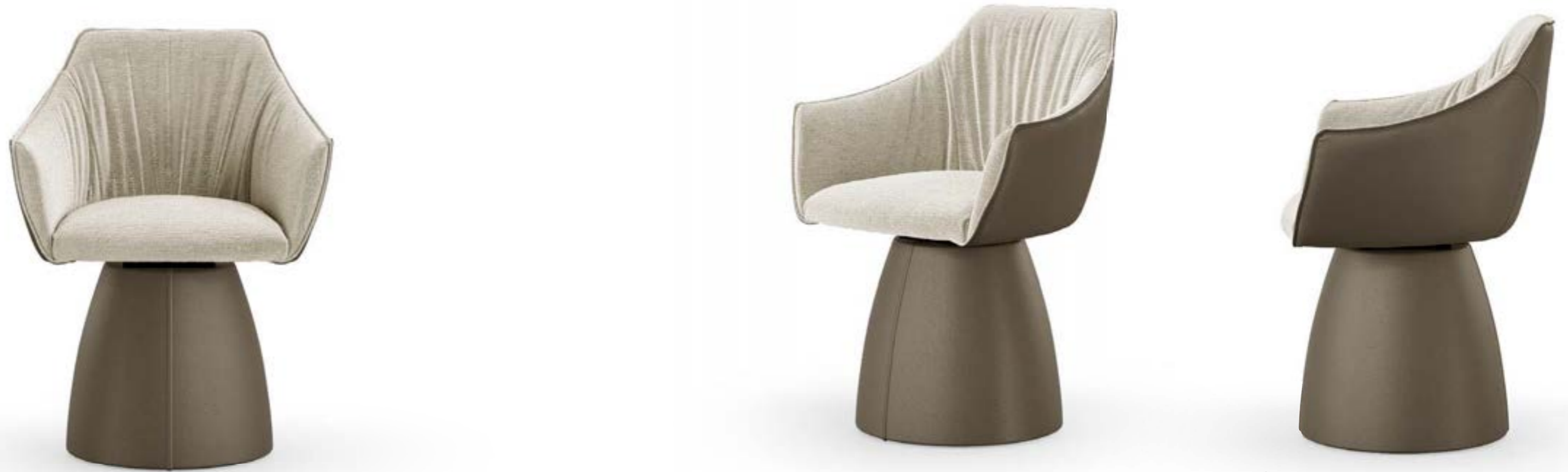
ERA PRESTIGE poltroncina, schienale interno e seduta: tessuto A 421, schienale esterno e base: pelle 5504 fango.