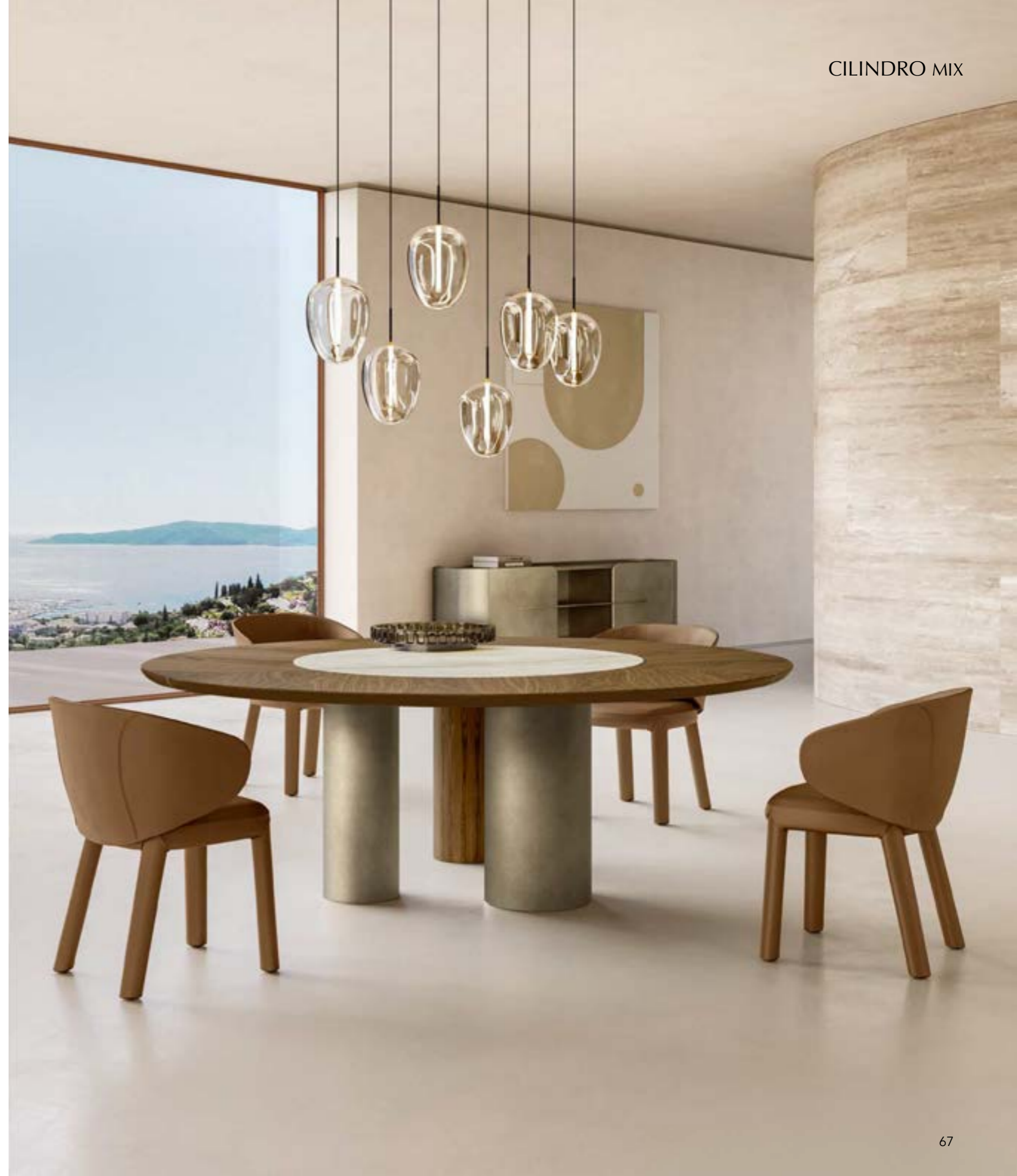
CILINDRO MIX_wood, ceramic top table, cm Ø 220, base: brushed platinum, top: Canaletto walnut, matt ceramic Silver Root bianco. GUJA arm armchair, leather 4234 tabacco chiaro · FOS_6 pendant lamp. NINFA sideboard, cm 220x48x h 74, brushed platinum.