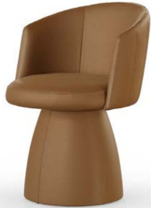
JANE PRESTIGE poltroncina, pelle 4234 tabacco chiaro.