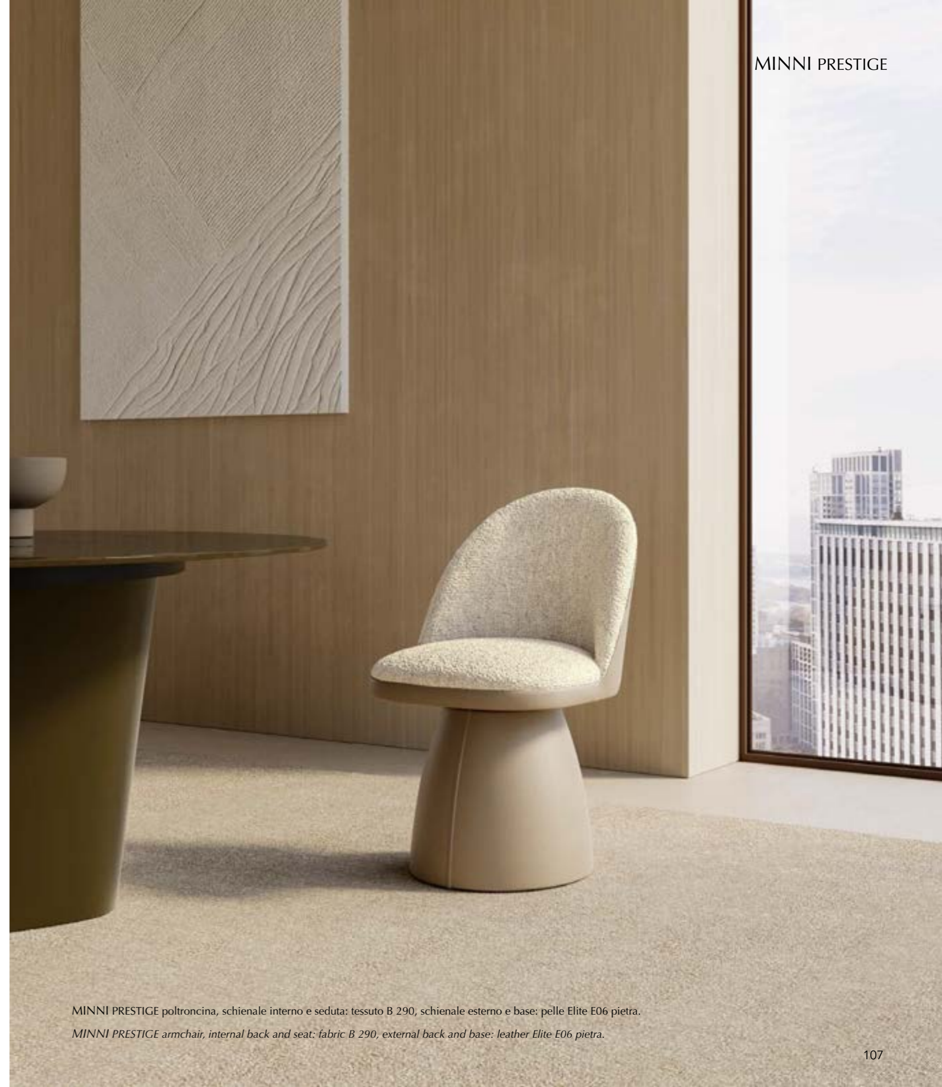
MINNI PRESTIGE poltroncina, schienale interno e seduta: tessuto B 290, schienale esterno e base: pelle Elite E06 pietra.

Stylish and refined chair characterized by a padded backrest and seat, offering great comfort and softness while highlighting attention to detail and high craftsmanship. The unique metal leg embraces the seat, providing a sense of great lightness. Also available with solid wood leg option or with swivel wood trestle. The version Prestige is characterized by a significant conical base completely upholstered fix or swivel. The stool has a swivel central base and height-adjustable seat, available also the stool with metal legs fix. Ideal for the living area but also suitable for contract environments. Upholstery available in eco-leather, fabric, or leather.