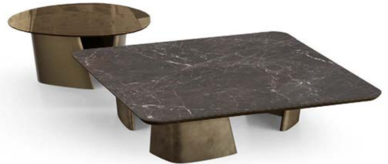
ACHILLE LOW_top ceramica Prime tavolino, cm 140x140x h 33 stone, base: bronzo spazzolato vintage, piano: ceramica Breccia Imperiale opaco. ACHILLE LOW_top cristallo, tavolino, cm 90x80x h 38 stone, base: bronzo spazzolato vintage, piano: cristallo fuso Bronzo trasparente.

ACHILLE LOW_ceramic top Prime coffee table, cm 140x100x h 33 stone, base: brushed platinum, top: glossy ceramic Mahal Silk. ACHILLE LOW_glass top coffee table, cm 160x84x h 38 stone, base: brushed platinum, top: Ivory fused transparent glass. ACHILLE LOW_glass top coffee table, cm 90x80x h 38 stone, base: brushed platinum, top: Ivory fused transparent glass.