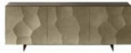
GRETA pag. 152