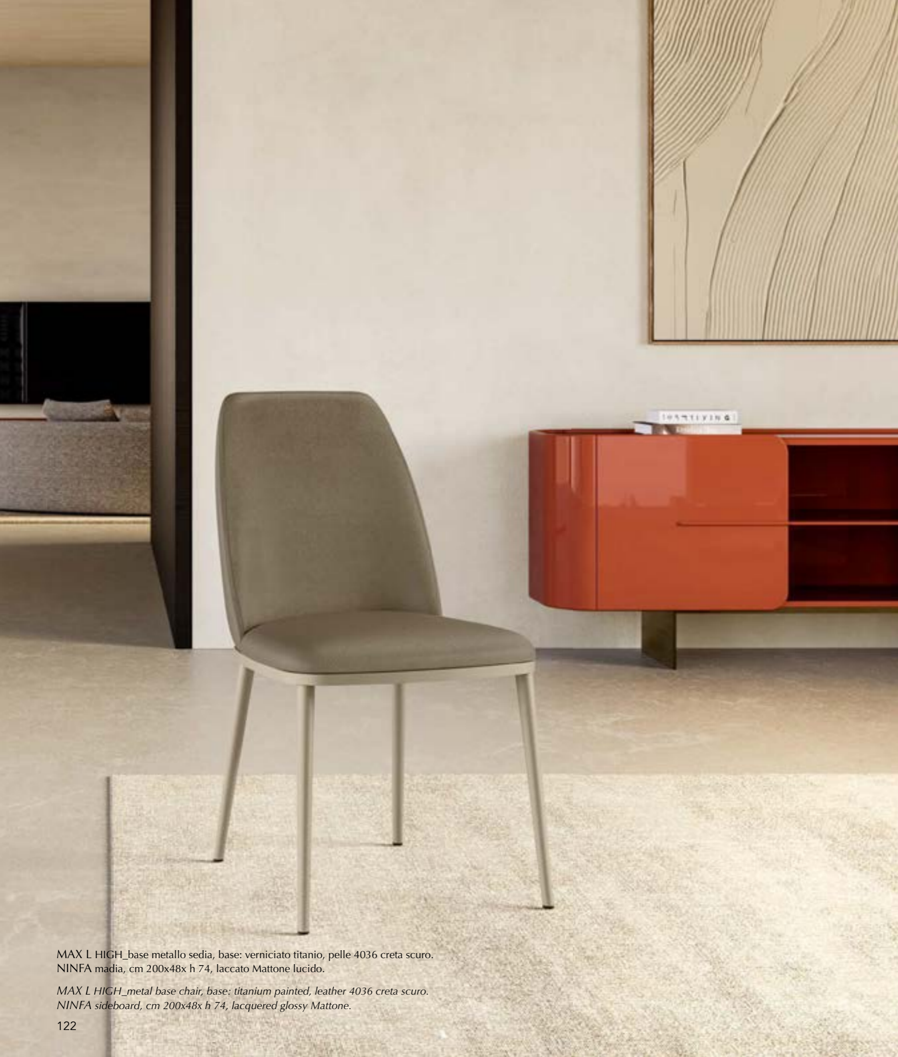
MAX L HIGH_base metallo sedia, base: verniciato titanio, pelle 4036 creta scuro. NINFA madia, cm 200x48x h 74, laccato Mattone lucido.