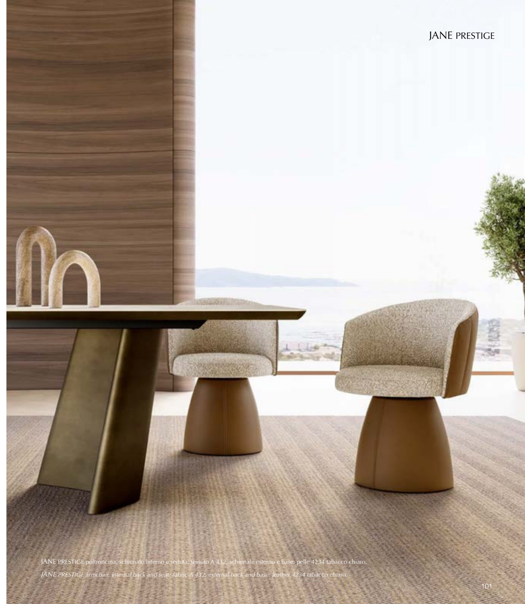
JANE PRESTIGE poltroncina, schienale interno e seduta: tessuto A 432, schienale esterno e base: pelle 4234 tabacco chiaro.

Refined and elegant fix and swivel base armchair with metal painted legs or central swivel wooden trestle. The version Prestige is characterized by a significant conical base completely upholstered fix or swivel. Important and enveloping backrest that enhances the extreme attention to detail, high tailoring and craftsmanship. Available also the stool that has a swivel central base and height-adjustable seat or stool with metal legs fix. The family is complete with the lounge with a central aluminum swivel base. Ideal for residential interiors, but also perfect for working environments. Armchair, stool and lounge are available in leather, eco-leather or fabric.