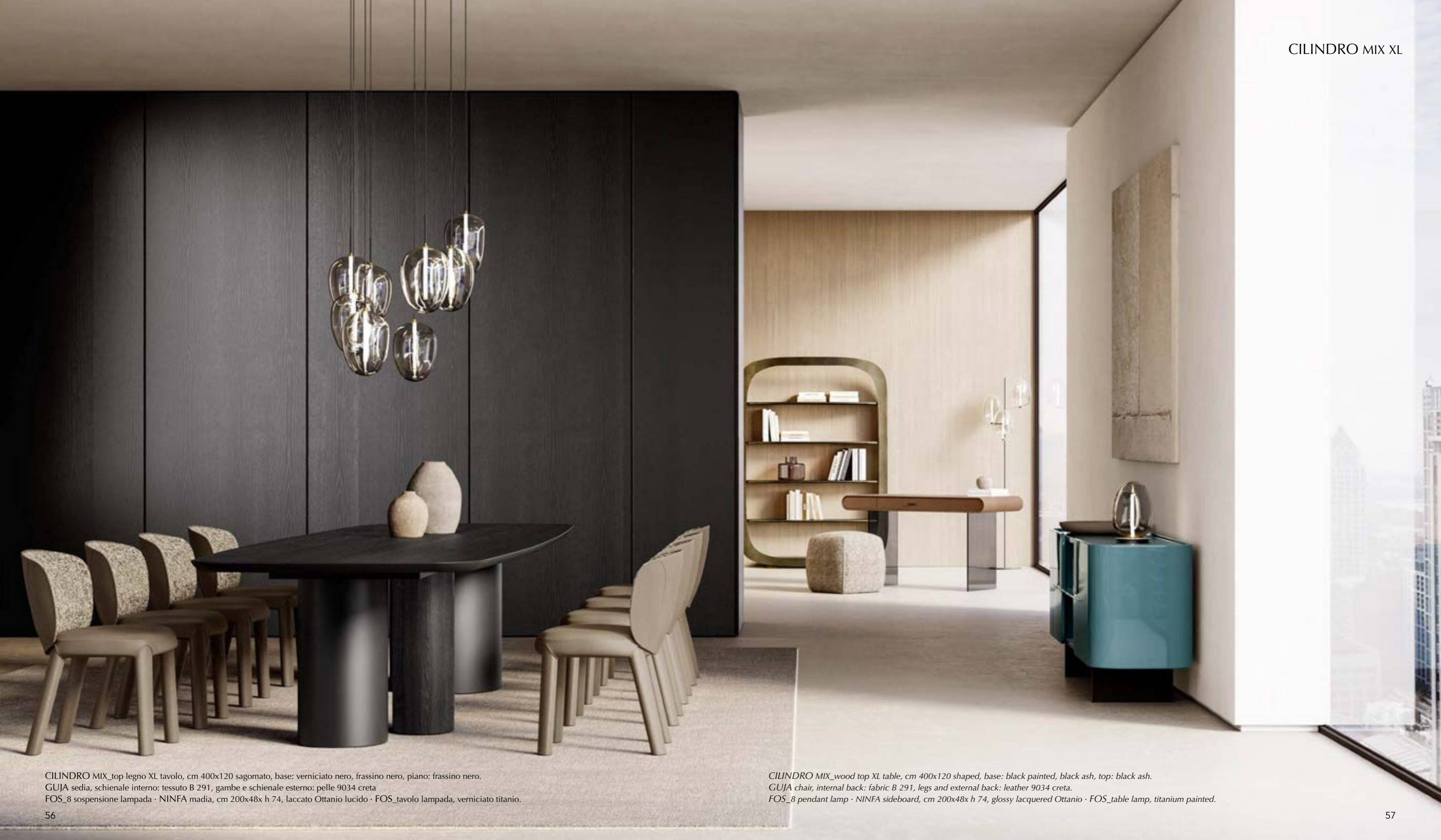
CILINDRO MIX_top legno XL tavolo, cm 400x120 sagomato, base: verniciato nero, frassino nero, piano: frassino nero. GUJA sedia, schienale interno: tessuto B 291, gambe e schienale esterno: pelle 9034 creta FOS_8 sospensione lampada · NINFA madia, cm 200x48x h 74, laccato Ottanio lucido · FOS_tavolo lampada, verniciato titanio.