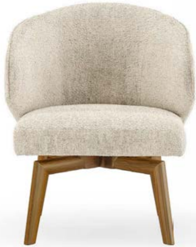
MANTA LOUNGE_base legno poltrona, base: noce Canaletto, tessuto B290.