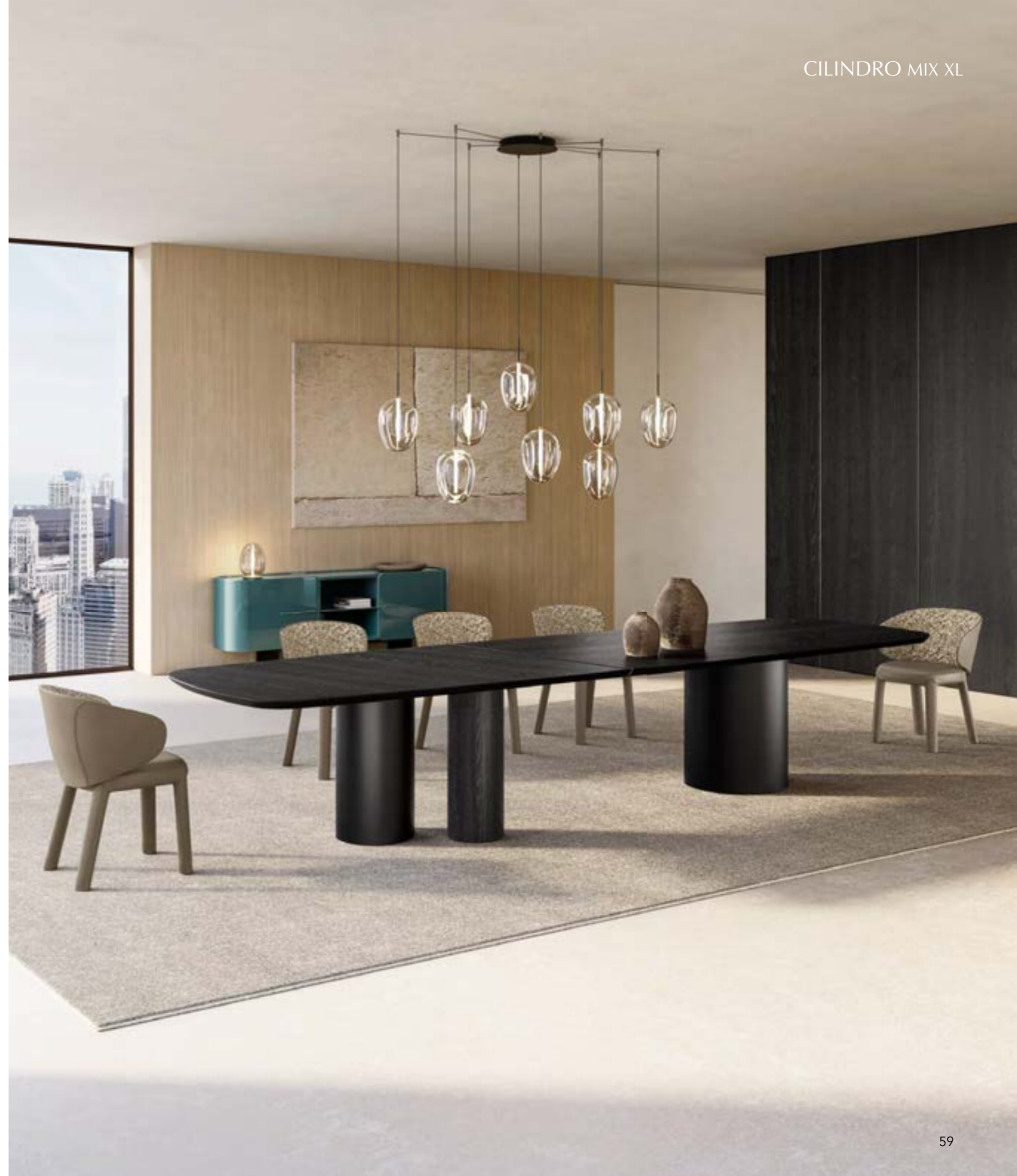
CILINDRO MIX_wood top XL table, cm 400x120 shaped, base: black painted, black ash, top: black ash. GUJA, GUJA arm chair and armchair, internal back: fabric B 291, legs and external back: leather 9034 creta. FOS_8 pendant lamp · NINFA sideboard, cm 200x48x h 74, glossy lacquered Ottanio · FOS_table lamp, titanium painted.