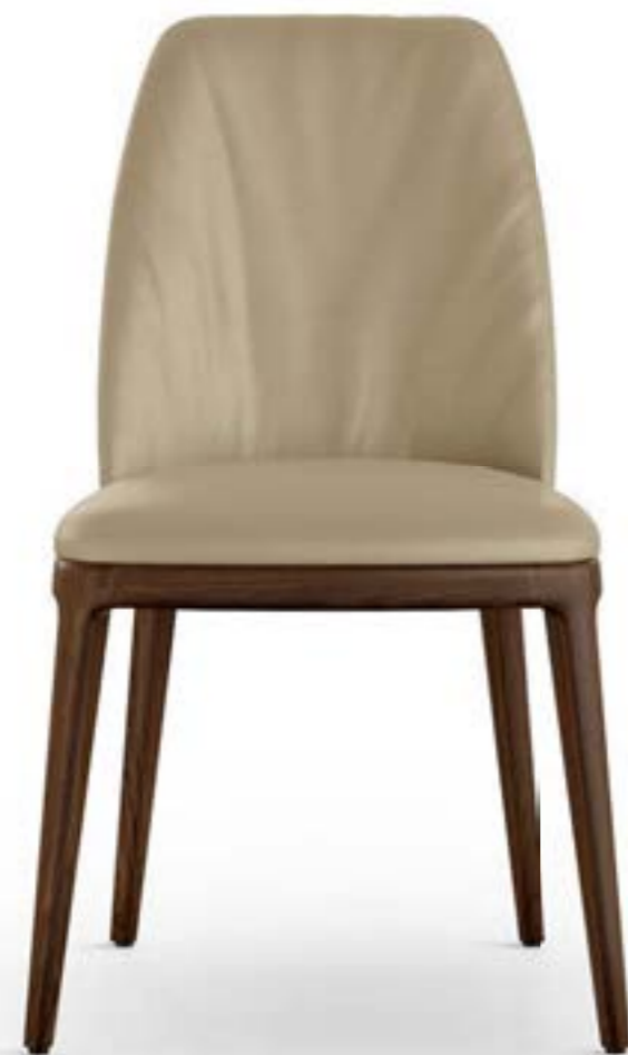
MAX L HIGH DELUXE_base legno sedia, base: frassino testa di moro, pelle Elite E18 smoke.