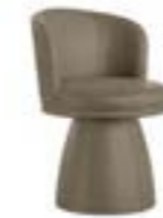
GINGER PRESTIGE pag. 88