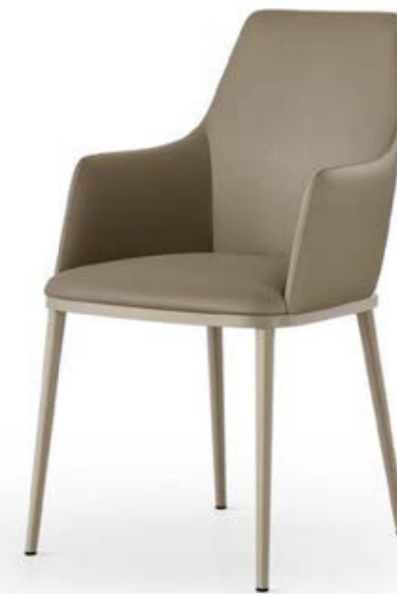
MAX arm HIGH_base metallo sedia, base: verniciato titanio, pelle 4036 creta scuro.