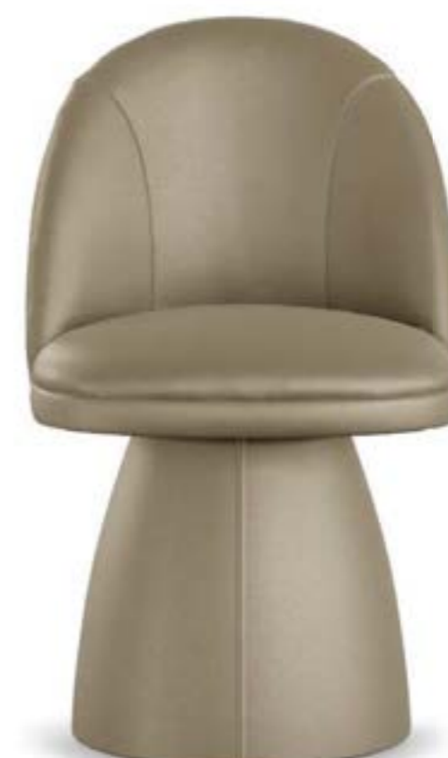
MINNI PRESTIGE poltroncina, pelle Elite E06 pietra.