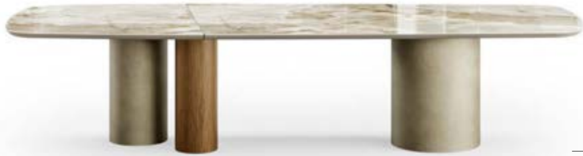
CILINDRO MIX_top ceramica Prime XL tavolo, cm 340x119 sagomato, base: platino spazzolato, noce Canaletto piano: ceramica Onice lucido. CILINDRO MIX_ceramic top Prime XL table, cm 340x119 shaped, base: brushed platinum, top: glossy ceramic Onice.