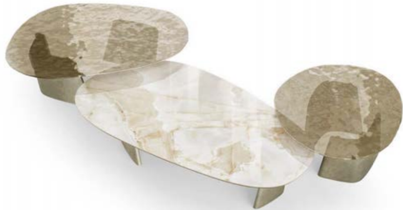
ACHILLE LOW_top ceramica Prime tavolino, cm 160x84x h 32,5 stone, base: platino spazzolato, piano: ceramica Onice bianco lucido. ACHILLE LOW_top cristallo tavolino, cm 120x79x h 38 stone, base: platino spazzolato, piano: cristallo fuso Avorio trasparente. ACHILLE LOW_top cristallo tavolino, cm 90x80x h 38 stone, base: platino spazzolato, piano: cristallo fuso Avorio trasparente. ACHILLE LOW_ceramic top Prime coffee table, cm 160x84x h 32,5 stone, base: brushed platinum, top: glossy ceramic Onice bianco. ACHILLE LOW_glass top coffee table, cm 120x79x h 38 stone, base: brushed platinum, top: Ivory fused transparent glass. ACHILLE LOW_glass top coffee table, cm 90x80x h 38 stone, base: brushed platinum, top: Ivory fused transparent glass.