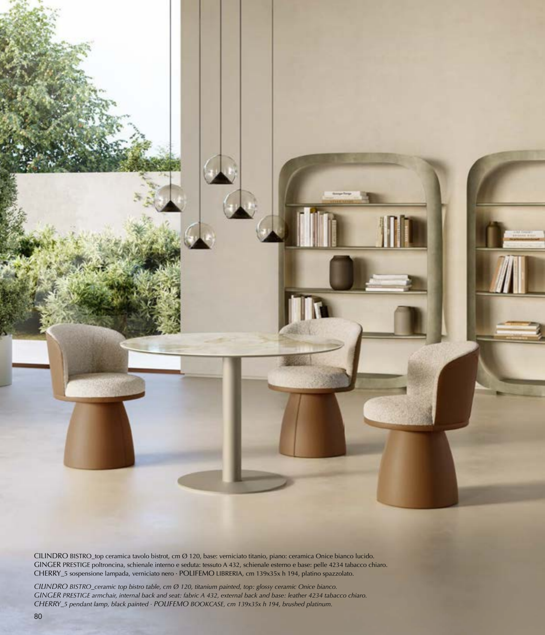
CILINDRO BISTRO_top ceramica tavolo bistrot, cm Ø 120, base: verniciato titanio, piano: ceramica Onice bianco lucido. GINGER PRESTIGE poltroncina, schienale interno e seduta: tessuto A 432, schienale esterno e base: pelle 4234 tabacco chiaro. CHERRY_5 sospensione lampada, verniciato nero · POLIFEMO LIBRERIA, cm 139x35x h 194, platino spazzolato.