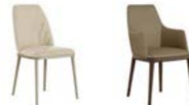
MAX HIGH pag. 114