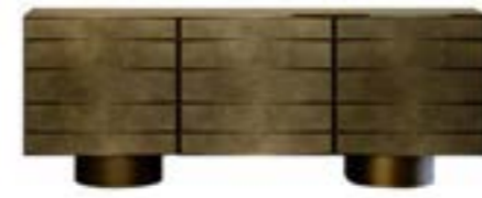
MAGICA pag. 158