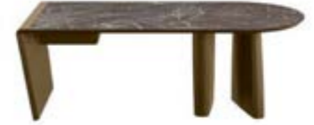
ALBERT DESK pag. 168