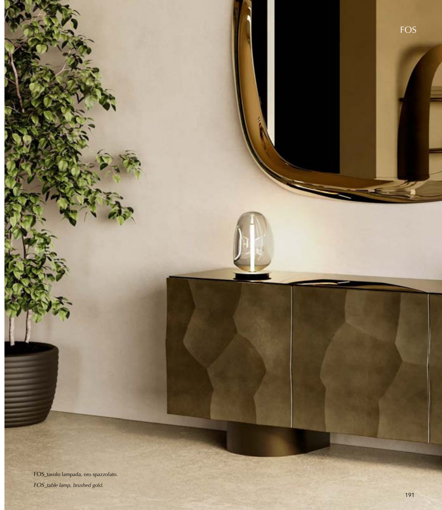
FOS_tavolo lampada, oro spazzolato.

FOS lamp challenges symmetry and celebrates imperfection. Its soft lines and irregular curves evoke a sense of naturalness and spontaneity. The unique, enveloping shape diffuses a gentle light that makes any environment enchanting. The inspiration comes from the reinterpretation of organic forms, creating a harmony that brings life to a welcoming space. The light gently spreads across surfaces, enveloping the environment in a warm aura. The lampshades are made of smoked borosilicate glass, and in the pendant version, its modular nature allows for various combinations that adapt versatilely to any space and style needs. There is also a floor version and a table version with a structure in painted titanium or brushed gold metal. FOS expresses functionality and aesthetics in perfect balance.