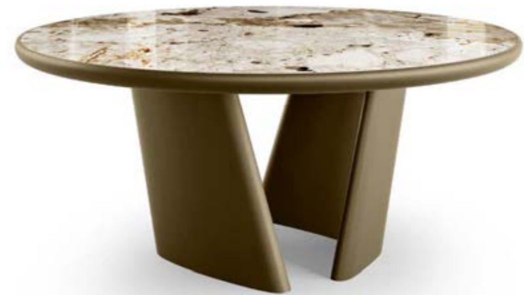
ACHILLE_top ceramica King tavolo, cm Ø 163, base: verniciato bronzo, piano: ceramica Patagonia lucido, bordo: verniciato bronzo. ACHILLE_ceramic top King table, cm Ø 163, base: bronze painted, top: glossy ceramic Patagonia, edge: bronze lacquered.

Una presenza raccolta dà vita ad un elemento iconico A composed presence brings an iconic element to life