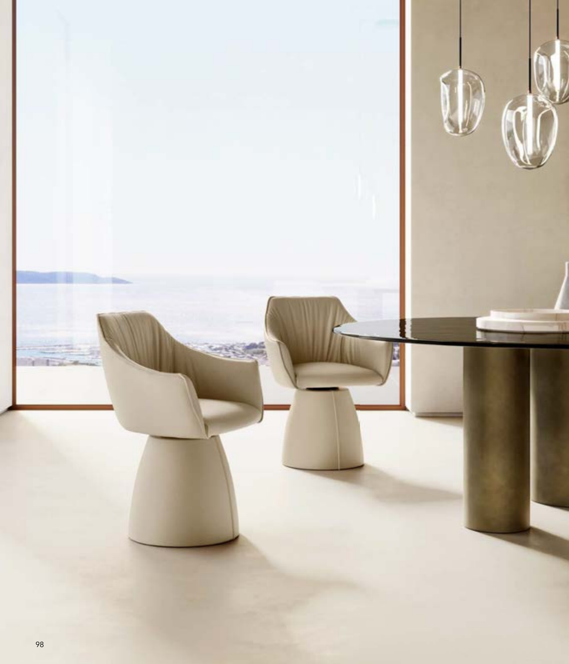
ERA PRESTIGE poltroncina, pelle 4548 beige chiaro.