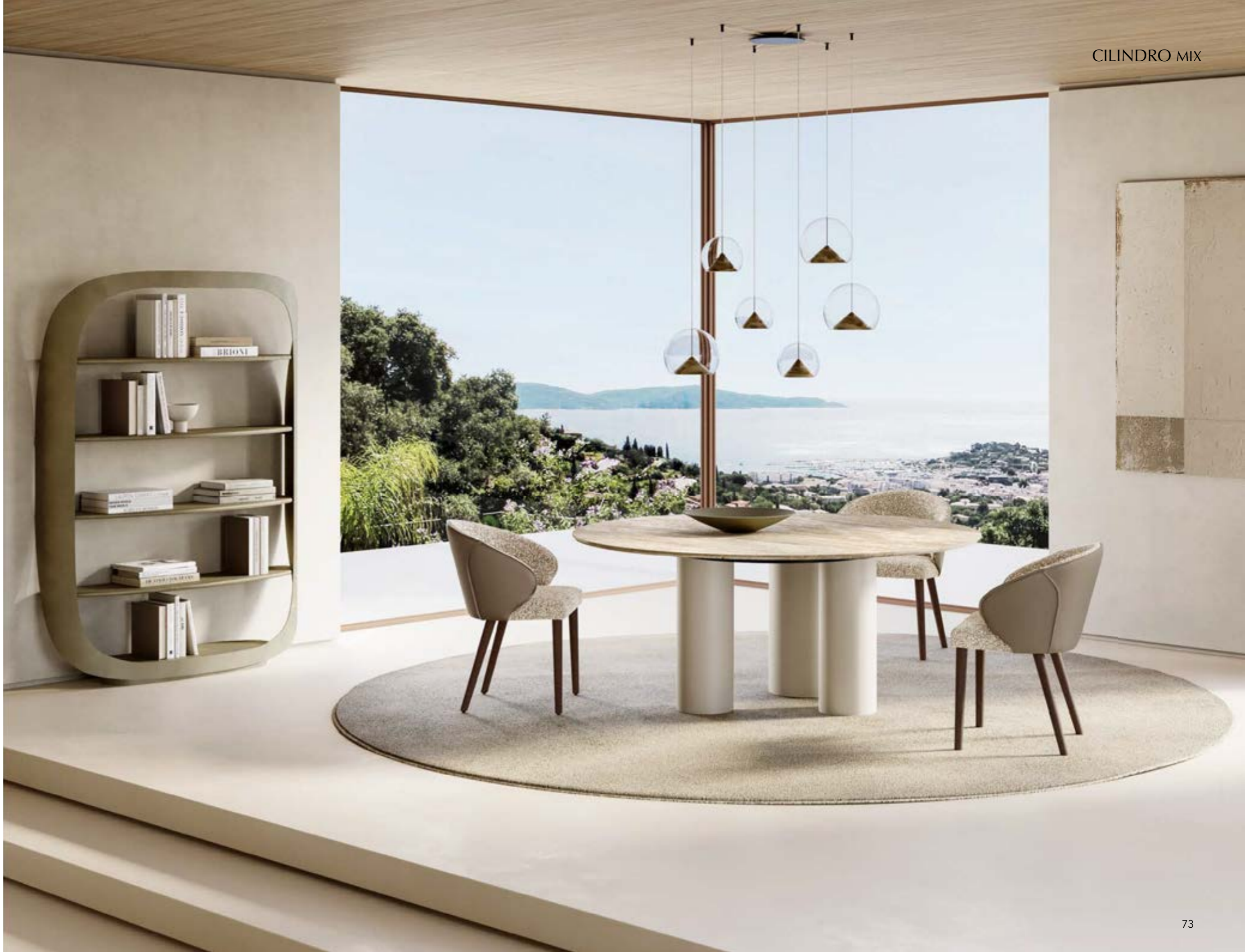
CILINDRO MIX_top marmo tavolo, cm Ø 180, base: verniciato avorio, piano: marmo Travertino opaco · MANTA arm_gambe legno poltroncina, gambe: frassino testa di moro, seduta: tessuto A 434, schienale: pelle 4036 creta scuro · CHERRY MIX_6 sospensione lampada, oro spazzolato. POLIFEMO LIBRERIA, cm 139x35x h 194, platino spazzolato.