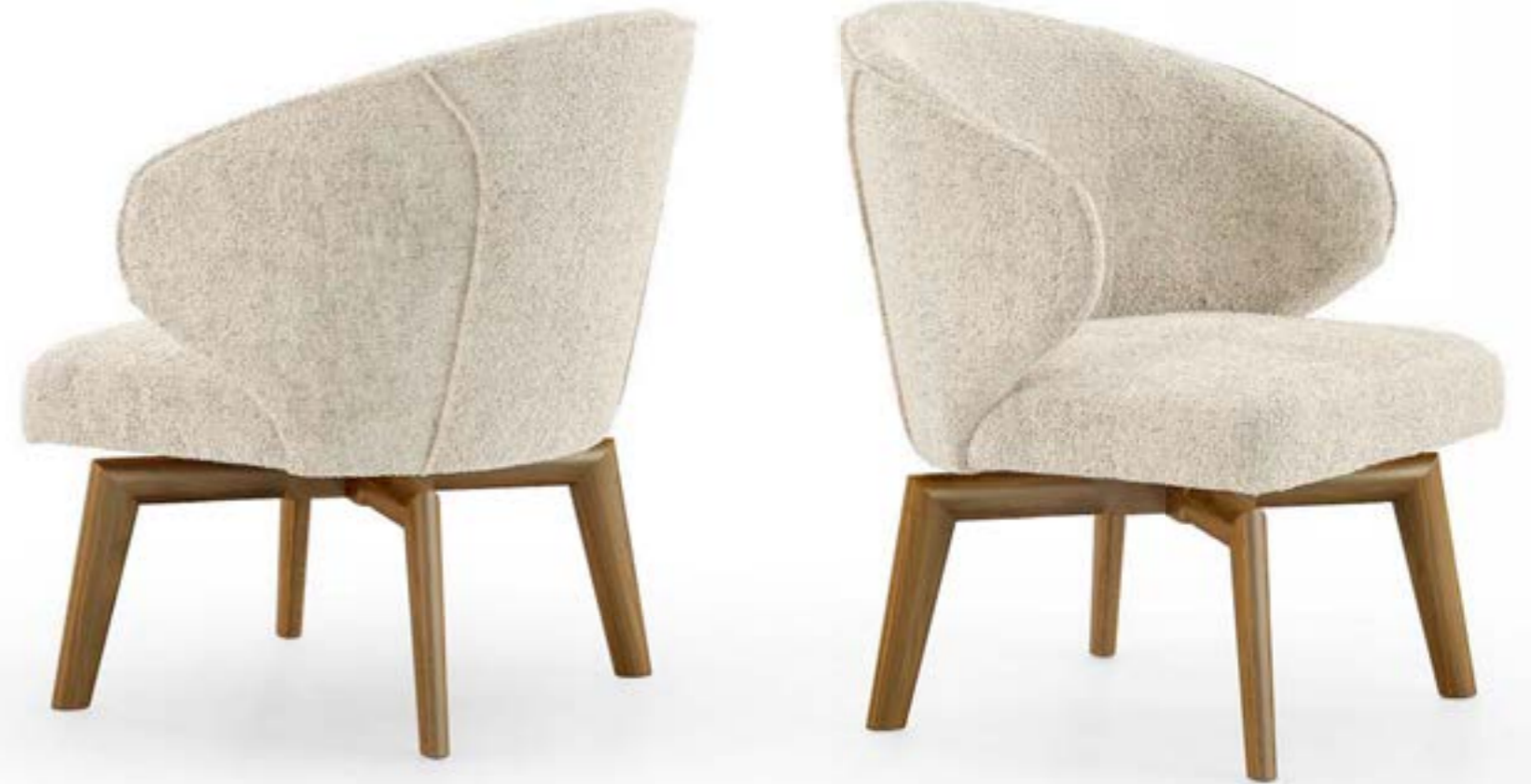
MANTA LOUNGE_wood base armchair, base: Canaletto walnut, fabric B290.