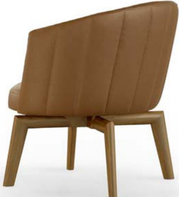
JANE LOUNGE_base legno poltrona, base: noce Canaletto, pelle 4234 tabacco chiaro.