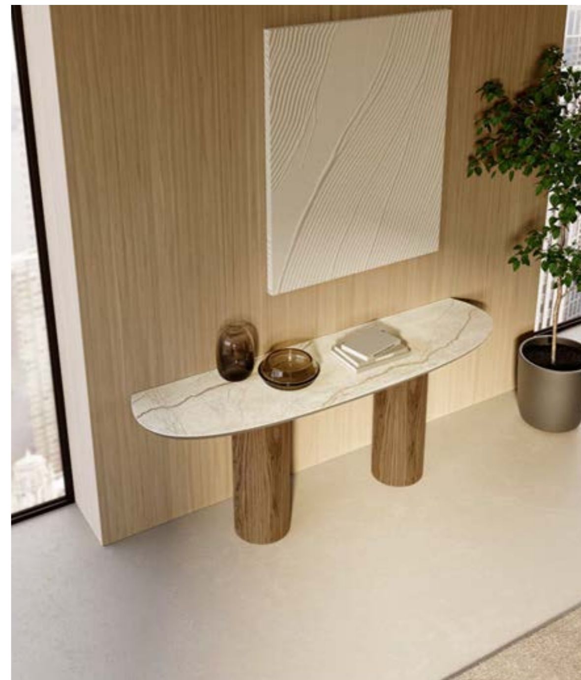
CILINDRO DUO CONSOLE_top ceramica, cm 180x50x h 72, base: noce Canaletto, piano: ceramica Silver Root bianco opaco.