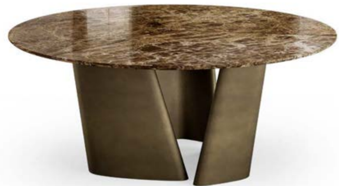
ACHILLE_top marmo tavolo, cm Ø 180, base: bronzo spazzolato vintage, piano: marmo Emperador lucido.