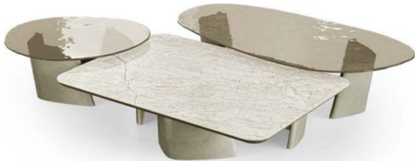
ACHILLE LOW_top ceramica Prime tavolino, cm 140x100x h 33 stone, base: platino spazzolato, piano: ceramica Mahal Silk. ACHILLE LOW_top cristallo tavolino, cm 160x84x h 38 stone, base: platino spazzolato, piano: cristallo fuso Avorio trasparente. ACHILLE LOW_top cristallo tavolino, cm 90x80x h 38 stone, base: platino spazzolato, piano: cristallo fuso Avorio trasparente.

ACHILLE LOW_ceramic top Prime coffee table, cm 140x100x h 33 stone, base: brushed platinum, top: glossy ceramic Mahal Silk. ACHILLE LOW_glass top coffee table, cm 160x84x h 38 stone, base: brushed platinum, top: Ivory fused transparent glass. ACHILLE LOW_glass top coffee table, cm 90x80x h 38 stone, base: brushed platinum, top: Ivory fused transparent glass.