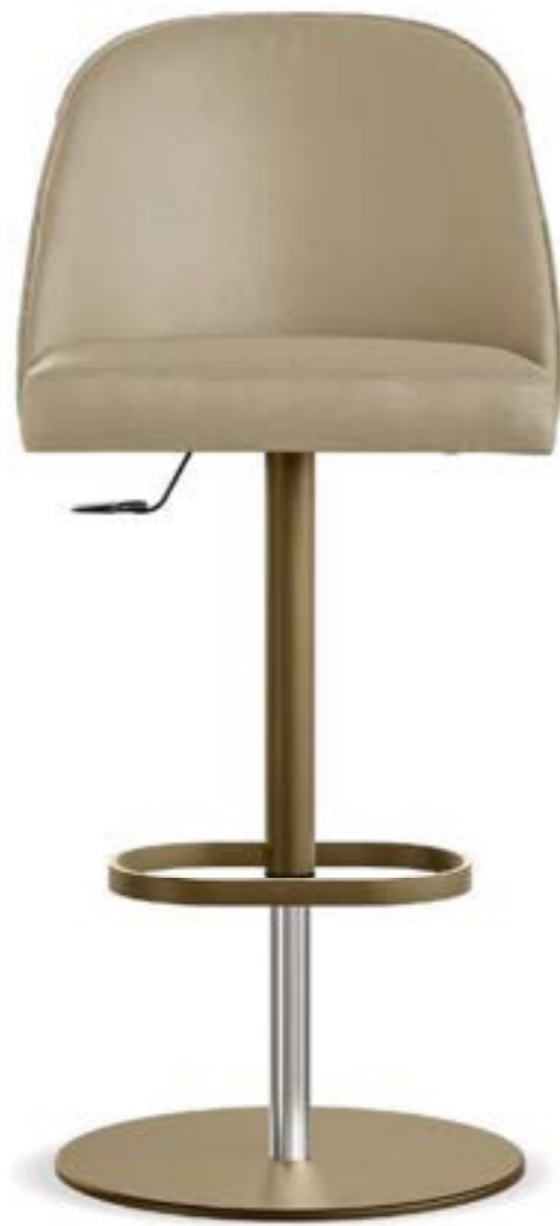
MANTA STOOL_base girevole sgabello, base: verniciato bronzo, pelle Elite E18 smoke.