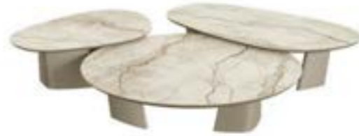
ACHILLE LOW pag. 172