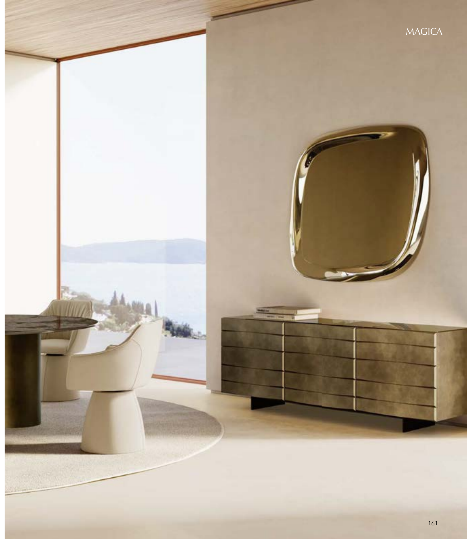
MAGICA sideboard, version A, cm 200x48x h 75, brushed bronze vintage, top: mirrored bronze glass.