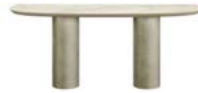
CILINDRO DUO CONSOLE pag. 150