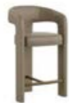
EGLE STOOL pag. 136