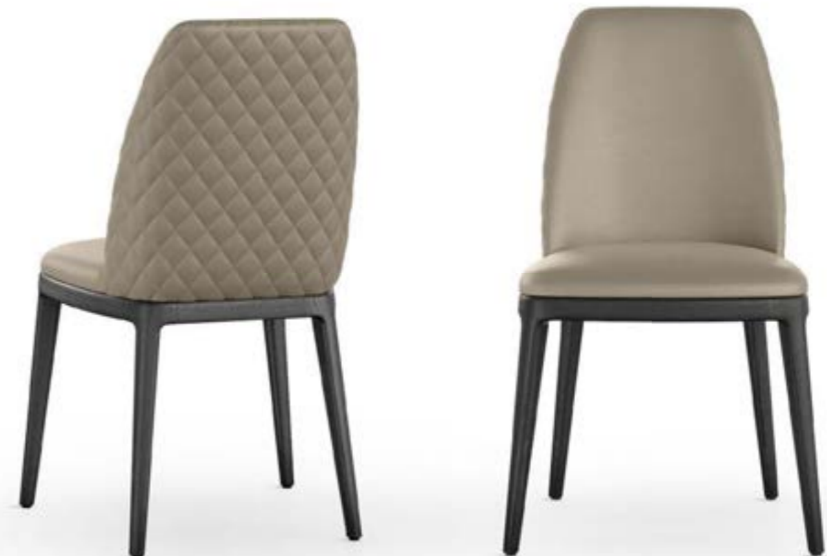
MAX L HIGH DIAMOND_base legno sedia, base: frassino nero, pelle Elite E08 topo.