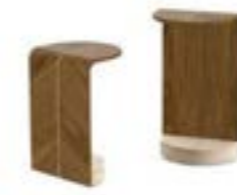
COBRA pag. 186