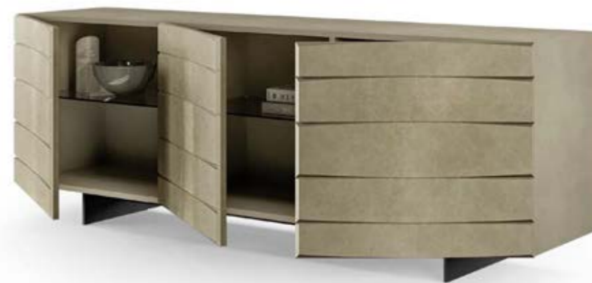
MAGICA madia, versione A, cm 200x48x h 73, platino spazzolato.