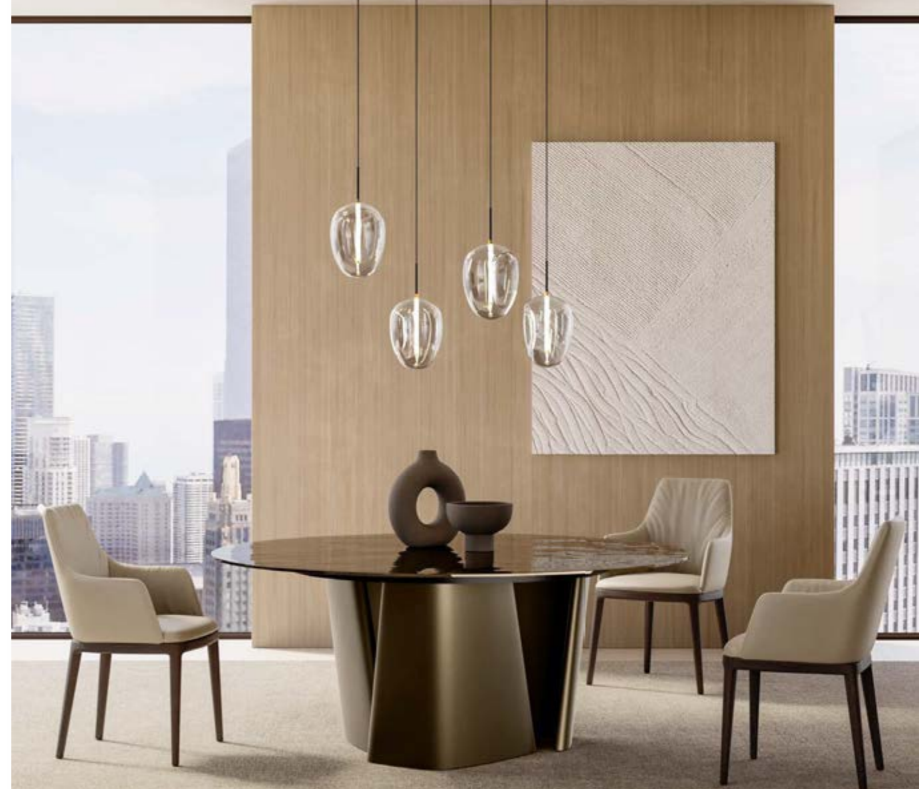
MAX arm HIGH DELUXE_base legno poltroncina, base: frassino testa di moro, pelle Elite E18 smoke.