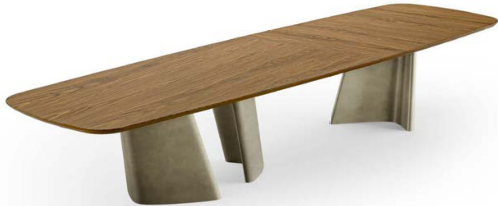
ACHILLE_top legno XL tavolo, cm 400x120 sagomato, base: platino spazzolato, piano: noce Canaletto · EGLE poltroncina, tessuto A 432. ACHILLE CONSOLE_top cristallo consolle, cm 180x50x h 72, base: platino spazzolato, piano: cristallo fuso verniciato Tortora lucido. MATISSE specchio, cm 120x120, cristallo specchiato.