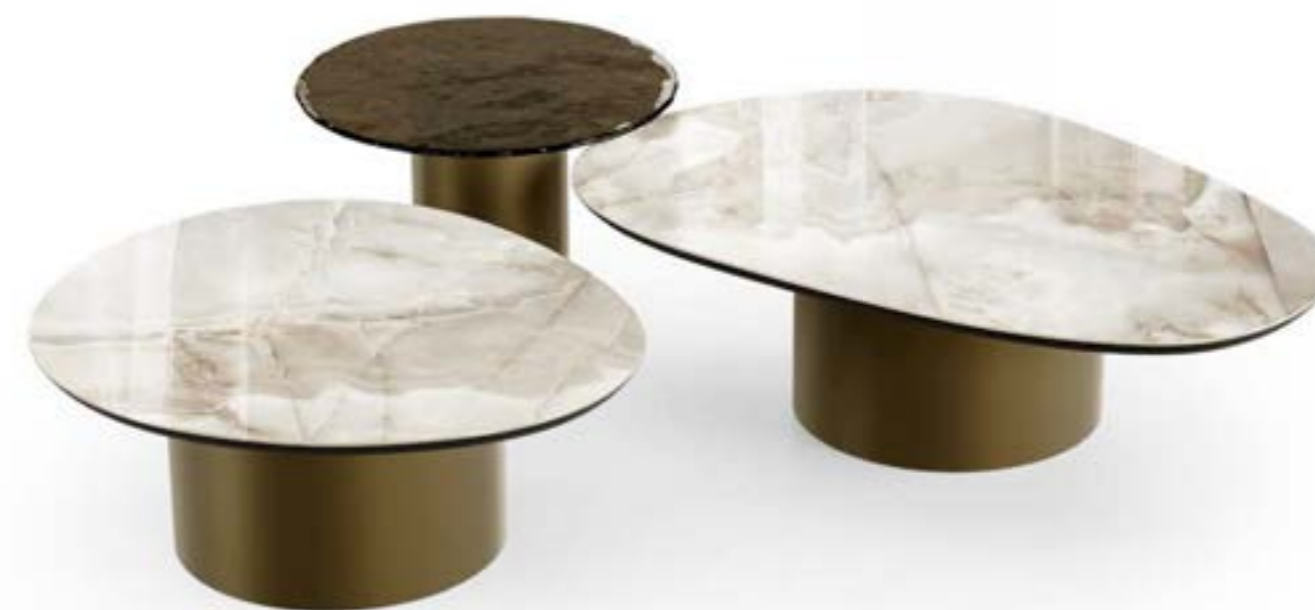
CILINDRO MIX LOW_top ceramica Prime tavolino, cm 119x79x h 35 stone, base: verniciato bronzo, piano: ceramica Onice lucido. CILINDRO MIX LOW_top ceramica Prime tavolino, cm 90x80x h 35 stone, base: verniciato bronzo, piano: ceramica Onice lucido. CILINDRO LOW_top cristallo tavolino, Ø cm 60x h 42, base: verniciato bronzo, piano: cristallo fuso verniciato Bronzo lucido.