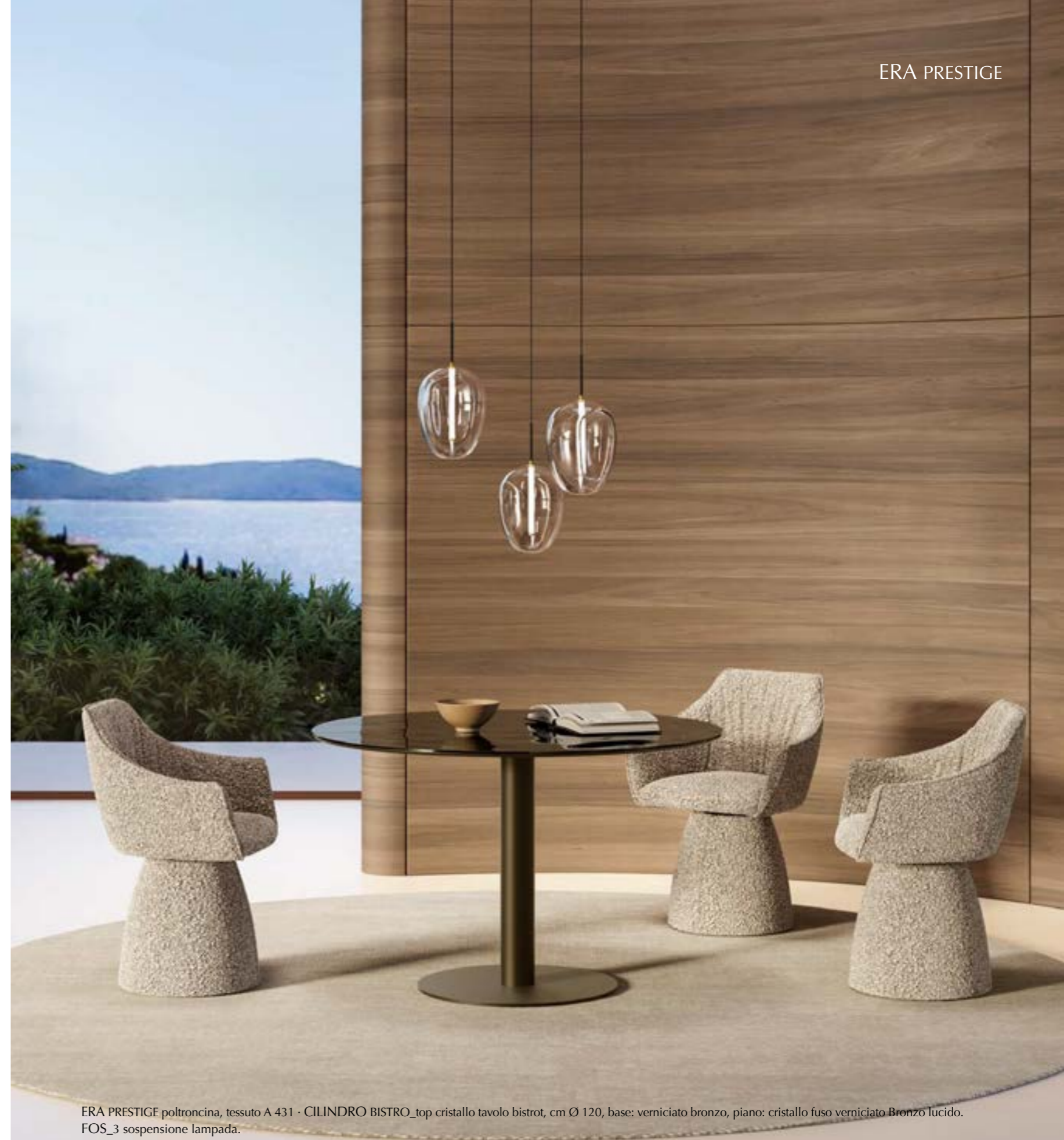
ERA PRESTIGE poltroncina, tessuto A 431 - CILINDRO BISTRO_top cristallo tavolo bistrot, cm Ø 120, base: verniciato bronzo, piano: cristallo fuso verniciato Bronzo lucido. FOS_3 sospensione lampada.

Prestigious and contemporary armchair. The sartorial touch can be seen in every detail of the seat such as the rich movement of wrinkles in the inner part of the back that embellish the cover. Soft and slender in the metal legs version, elegant and refined in the wooden legs version or with central swivel wood trestle. The version Prestige is characterized by a significant conical base completely upholstered fix or swivel. Available also the stool that has a swivel central base and height-adjustable seat or stool with metal legs fix. Designed for home, but also perfect for working spaces. Available in leather, eco-leather or fabric.