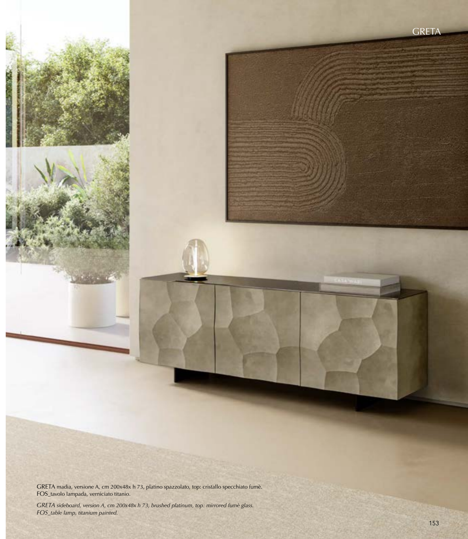
GRETA madia, versione A, cm 200x48x h 73, platino spazzolato, top: cristallo specchiato fumè. FOS_tavolo lampada, verniciato titanio.

Clean lines and balanced proportions define the Greta sideboard. The suspended structure interacts with the compact volume, while the elaborate doors introduce a refined interplay of surfaces and light. Material depth and contemporary elegance are enhanced by the special platinum and vintage bronze brushing. A furnishing element designed to blend in naturally, enhancing the space without overpowering it. Available also with rounded metal basement.