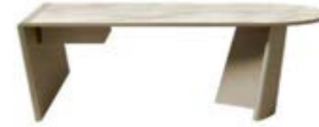
ACHILLE DESK pag. 164