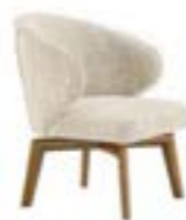
MANTA LOUNGE pag. 132