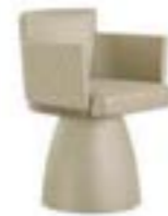
ELY PRESTIGE pag. 110