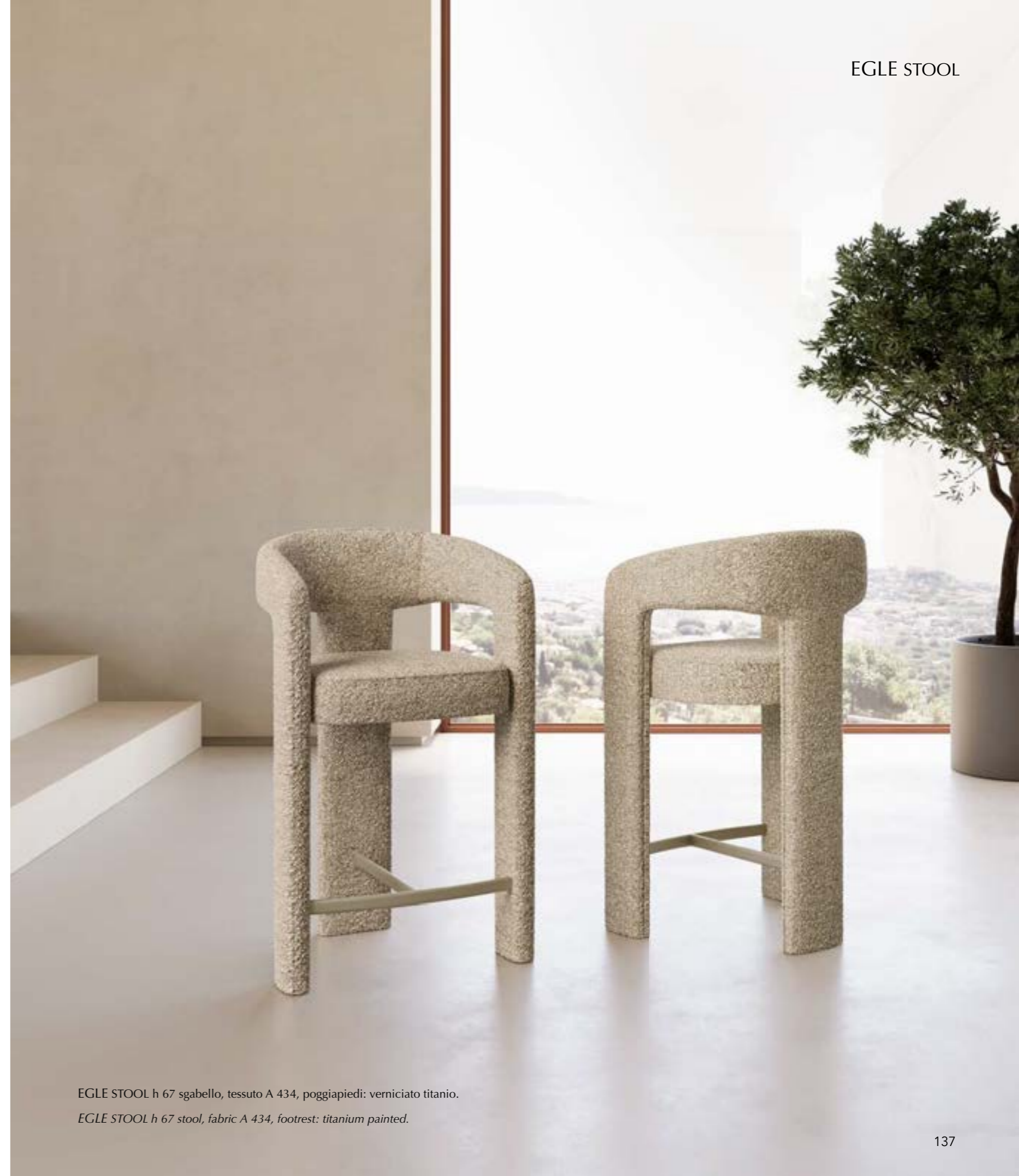
EGLE STOOL h 67 sgabello, tessuto A 434, poggiatesta: verniciato titanio.

The stool is inspired by the armchair Egle with a soft and enveloping design. Its unique style is inspired by Etruscan architecture, characterized by a succession of curved and broken lines that create a rigorous and clean pattern. A perfect balance between timeless elegance and modern comfort. Available in leather, eco-leather or fabric.