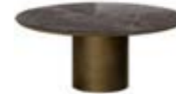
CILINDRO LOUNGE pag. 76