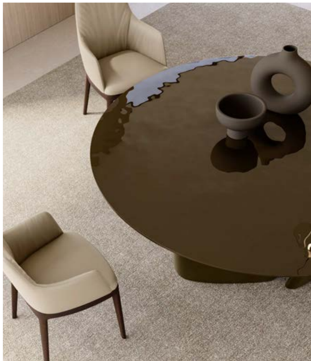
ACHILLE_top cristallo tavolo, cm Ø 180, base: verniciato bronzo, piano: cristallo fuso verniciato Bronzo lucido. MAX arm HIGH DELUXE_base legno poltroncina, base: frassino testa di moro, pelle Elite E18 smoke. FOS_4 sospensione lampada.