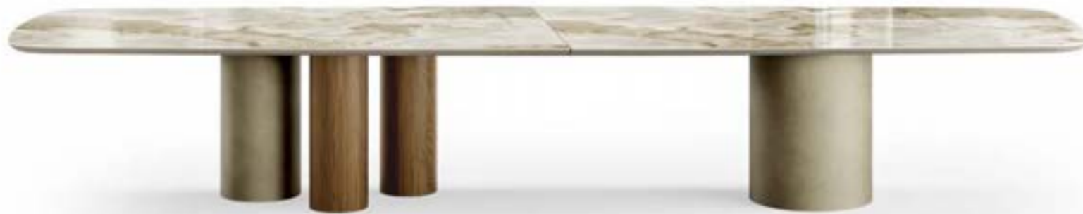
CILINDRO MIX_top ceramica Prime XL tavolo, cm 460x119 sagomato, base: platino spazzolato, noce Canaletto piano: ceramica Onice lucido. CILINDRO MIX_ceramic top Prime XL table, cm 460x119 shaped, base: brushed platinum, top: glossy ceramic Onice.