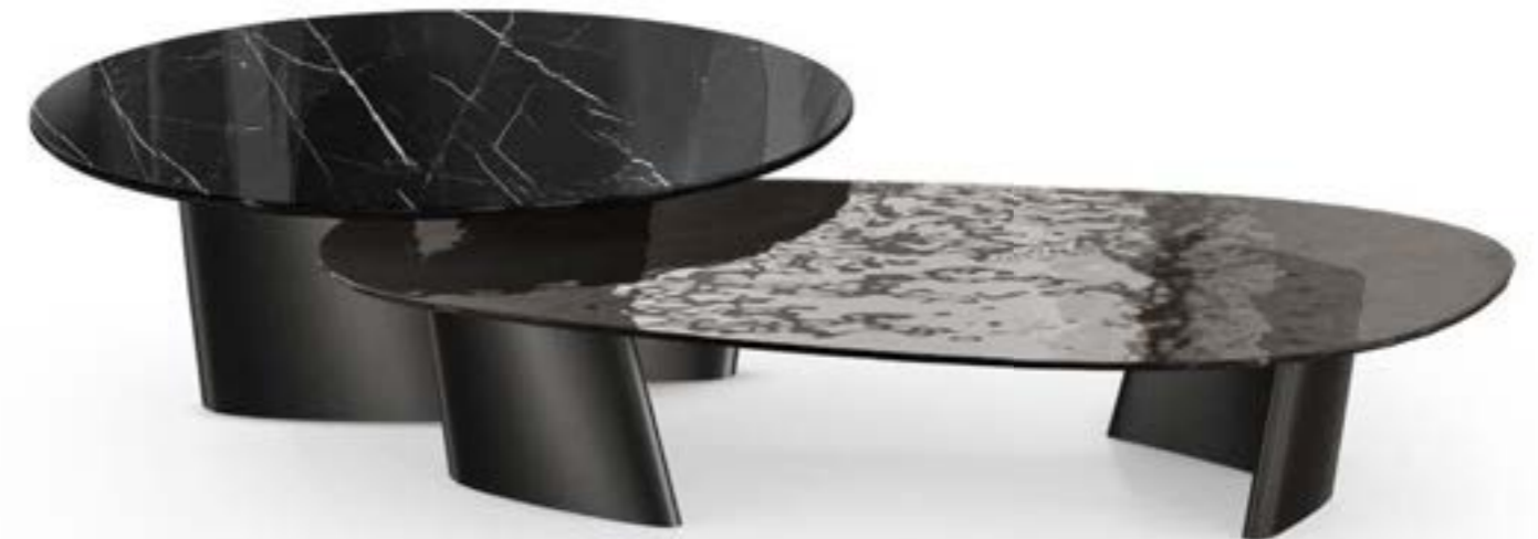
ACHILLE LOW_top cristallo tavolino, cm 160x84x h 33 stone, base: verniciato nero, piano: cristallo fuso Fumè trasparente. ACHILLE LOW_top marmo tavolino, Ø cm 120x h 38, base: verniciato nero, piano: marmo Nero Marquinia lucido.

ACHILLE LOW_ceramic top Prime coffee table, Ø cm 160x h 33, base: titanium painted, top: matt ceramic Silver Root bianco. ACHILLE LOW_ceramic top Prime coffee table, cm 160x84x h 38,5 stone, base: matt ceramic Silver Root bianco. ACHILLE LOW_ceramic top Prime coffee table, cm 119x79x h 38,5, base: matt ceramic Silver Root bianco.