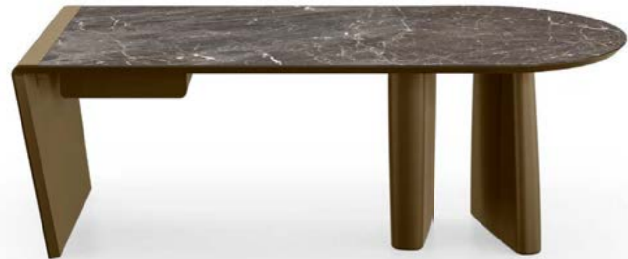
ALBERT DESK_top ceramica scrivania, struttura, base e cassetto: laccato bronzo, piano: ceramica Breccia Imperiale opaco. MORITZ_5 ways poltroncina, base: verniciato bronzo, pelle 4548 beige chiaro · ERA_4 ways poltroncina, base: verniciato bronzo, pelle 4548 beige chiaro. BENDY_Ax2 + Bx2 + Bx2 libreria, bronzo.