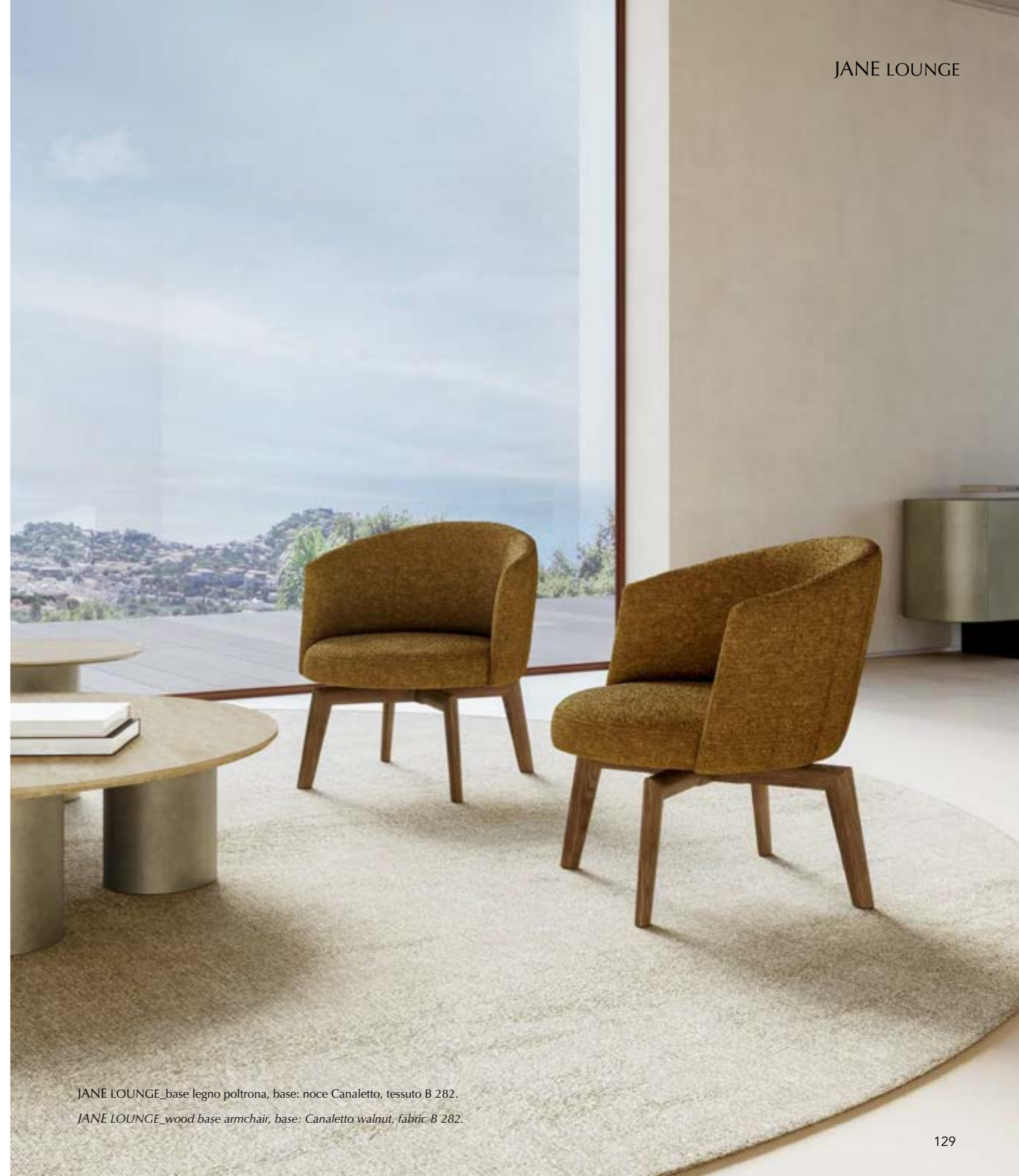
JANE LOUNGE_base legno poltrona, base: noce Canaletto, tessuto B 282.

Armchair deriving from Jane armchair. It features a significant and embracing backrest that highlights extreme attention to detail, high craftsmanship, and artisanal workmanship. Ideal for residential interiors but also suitable for work spaces. It has a aluminium swivel central base or wood base swivel. Available in leather, eco-leather or fabric.