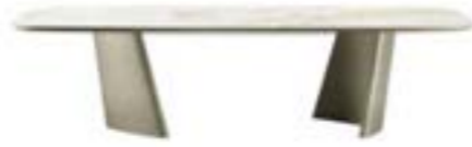
ACHILLE pag. 08