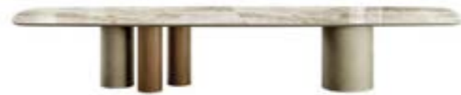
CILINDRO MIX Top XL / XL top pag. 44