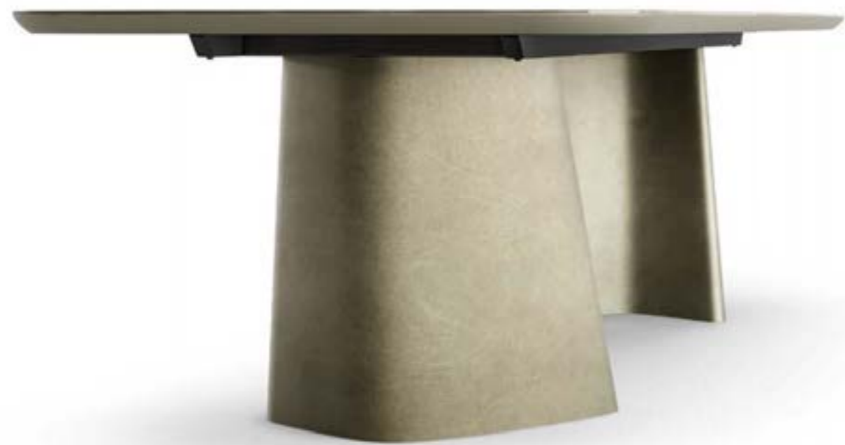
ACHILLE_top ceramica Prime tavolo, cm 300x120 sagomato, base: platino spazzolato, piano: ceramica Onice bianco lucido. GUJA, GUJA arm sedia e poltroncina, tessuto A 434 · FOS_7 sospensione lampada. GRETA madia, versione A, cm 200x48 x h 73, platino spazzolato, top: cristallo specchiato fumè. ACHILLE CONSOLE_top ceramica, consolle, cm 180x50 h 72, base: platino spazzolato, piano: ceramica Onice bianco lucido. LET specchio, cm 180x 90, cristallo specchiato.