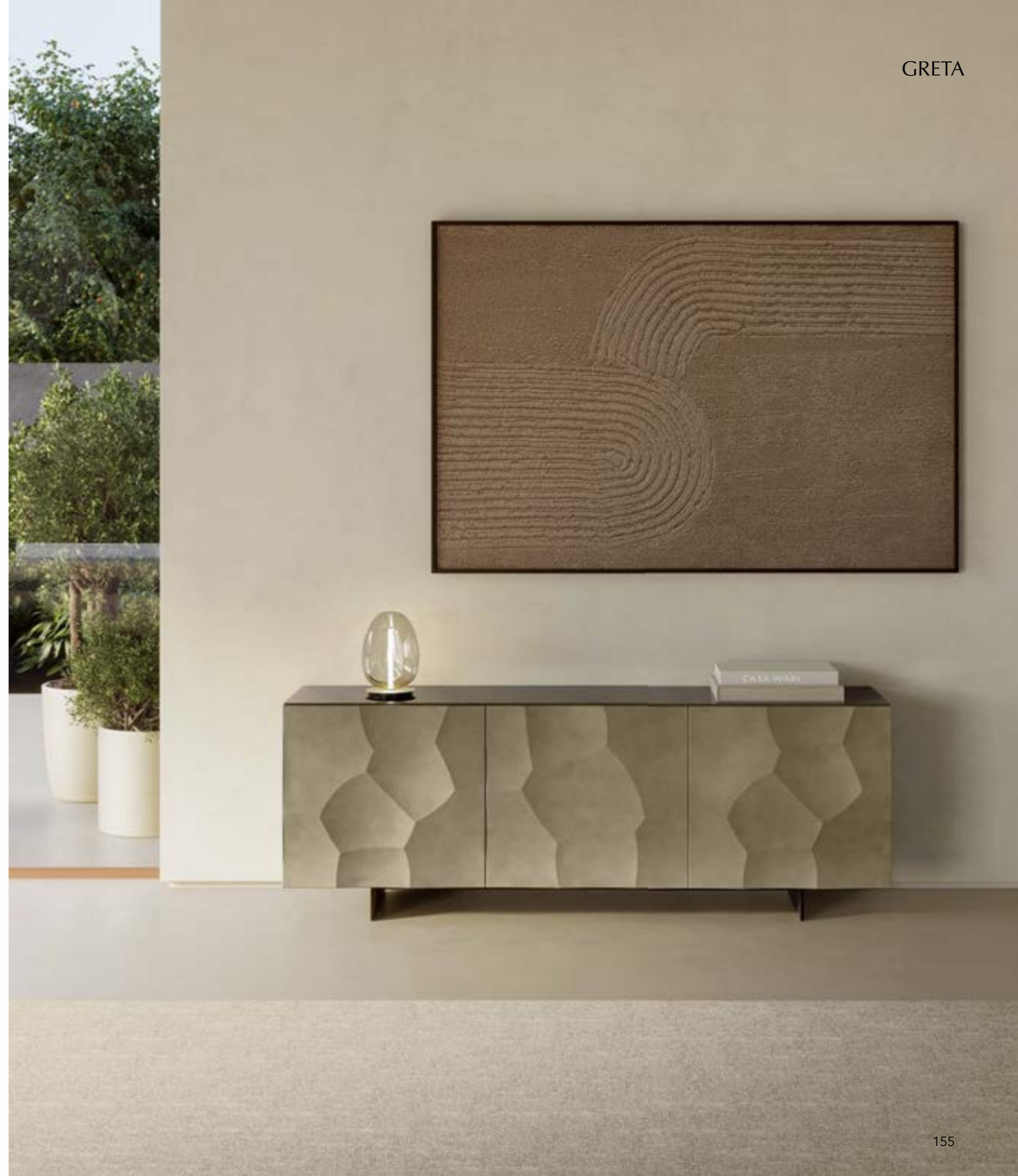
GRETA sideboard, version A, cm 200x48x h 73, brushed platinum, top: mirrored fumè glass. FOS_table lamp, titanium painted.