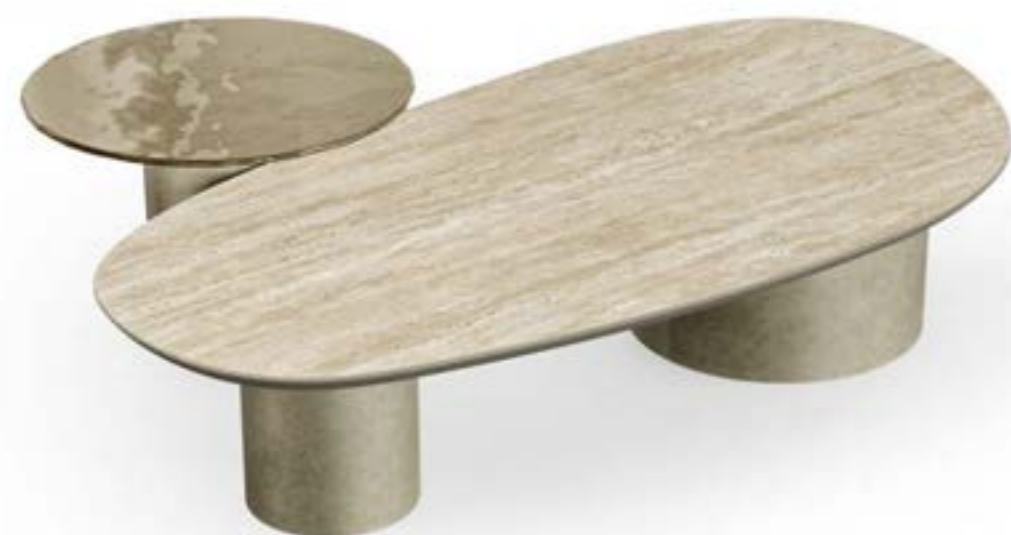
CILINDRO MIX LOW_top ceramica Prime tavolino, cm 160x84x h 35 stone, base: platino spazzolato, piano: ceramica Travertino opaco. CILINDRO LOW_top cristallo, Ø cm 60x h 42, base: platino spazzolato, piano: cristallo fuso verniciato Tortora lucido.