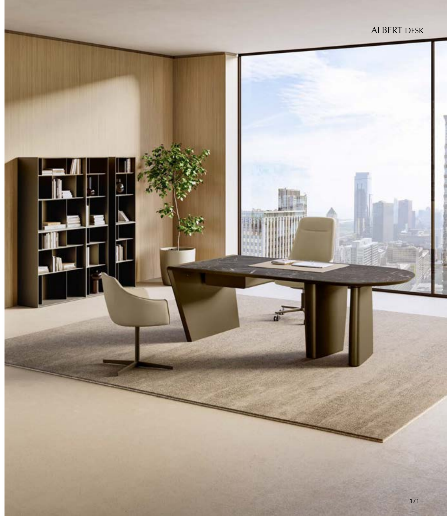
ALBERT DESK_ceramic top desk, frame, base and drawer: bronze lacquered, top: matt ceramic Breccia Imperiale. MORITZ_5 ways armchair, base: bronze painted, leather 4548 beige chiaro · ERA_4 ways armchair, base: bronze painted, leather 4548 beige chiaro. BENDY_Ax2 + Bx2 + Bx2 bookcase, bronze.