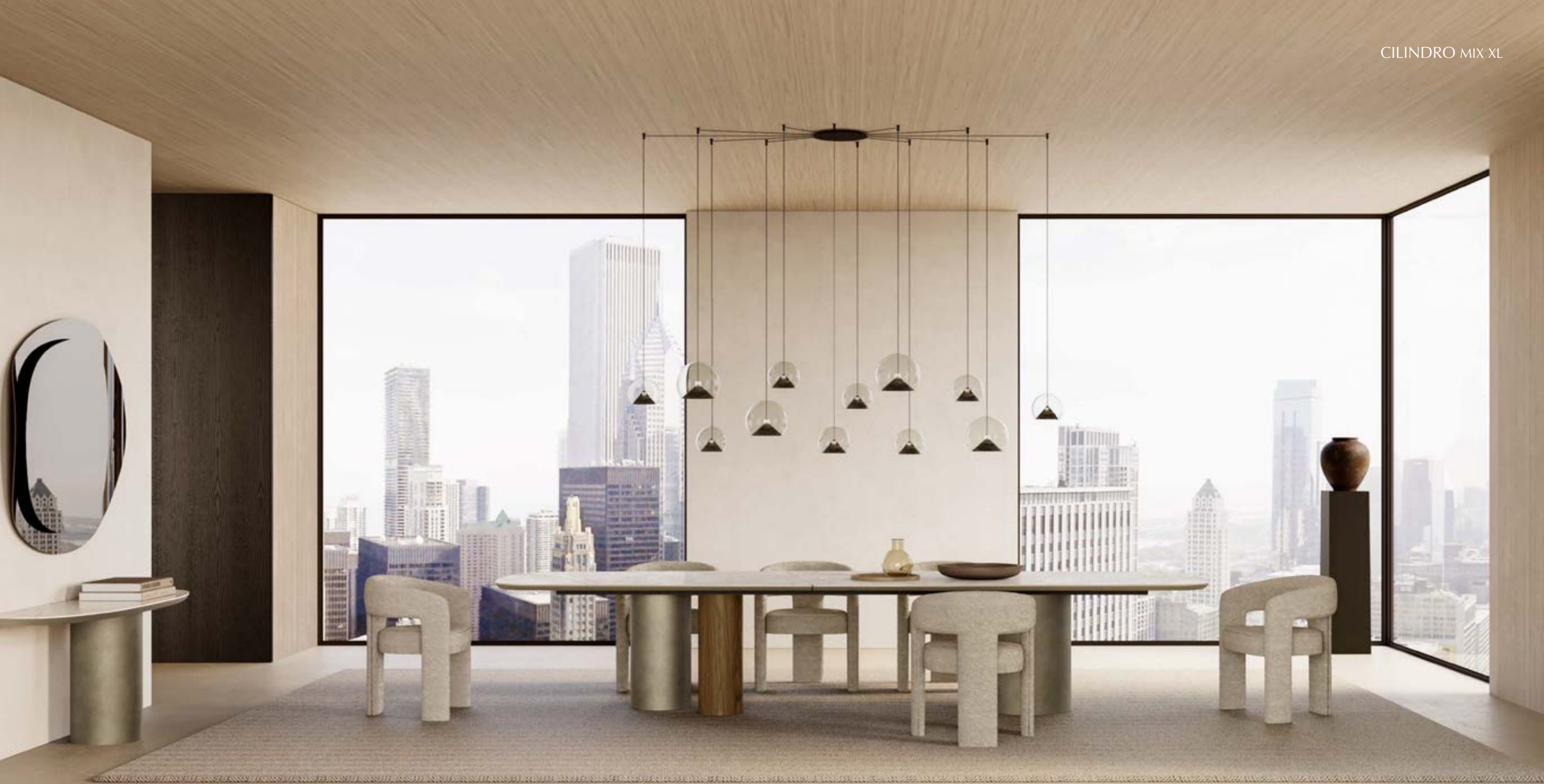
CILINDRO MIX_top ceramica Prime XL tavolo, cm 400 x 119 sagomato, base: platino spazzolato, noce Canaletto, piano: ceramica Mahal Silk. EGLE poltroncina, tessuto B 280 - CHERRY MIX_12 sospensione lampada, verniciato nero. CILINDRO CONSOLE_top ceramica consolle, cm 180x50x h 72, base: platino spazzolato, piano: ceramica Mahal Silk. GALLERY specchio, cm 132x122, cristallo specchiato fumè.