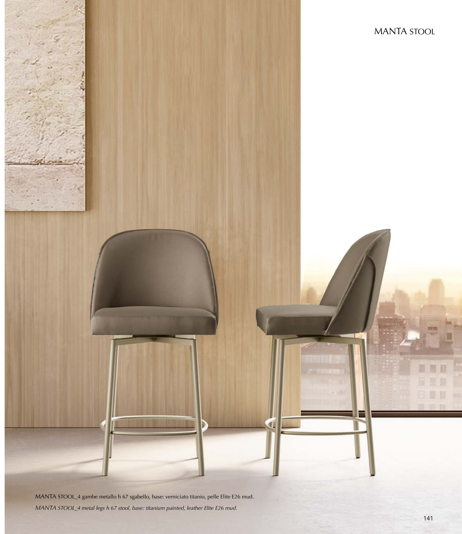
MANTA STOOL_4 gambe metallo h 67 sgabello, base: verniciato titanio, pelle Elite E26 mud.

Stool deriving from the MANTA armchair. The deep sartorial cares highlighted by important details the upholstery that enhance the excellent craftsmanship of the manufacture. The Stool is available with central swivel base adjustable in the height, or with 4 metal legs with fix or swivel seat. Available in leather, eco-leather or fabric.