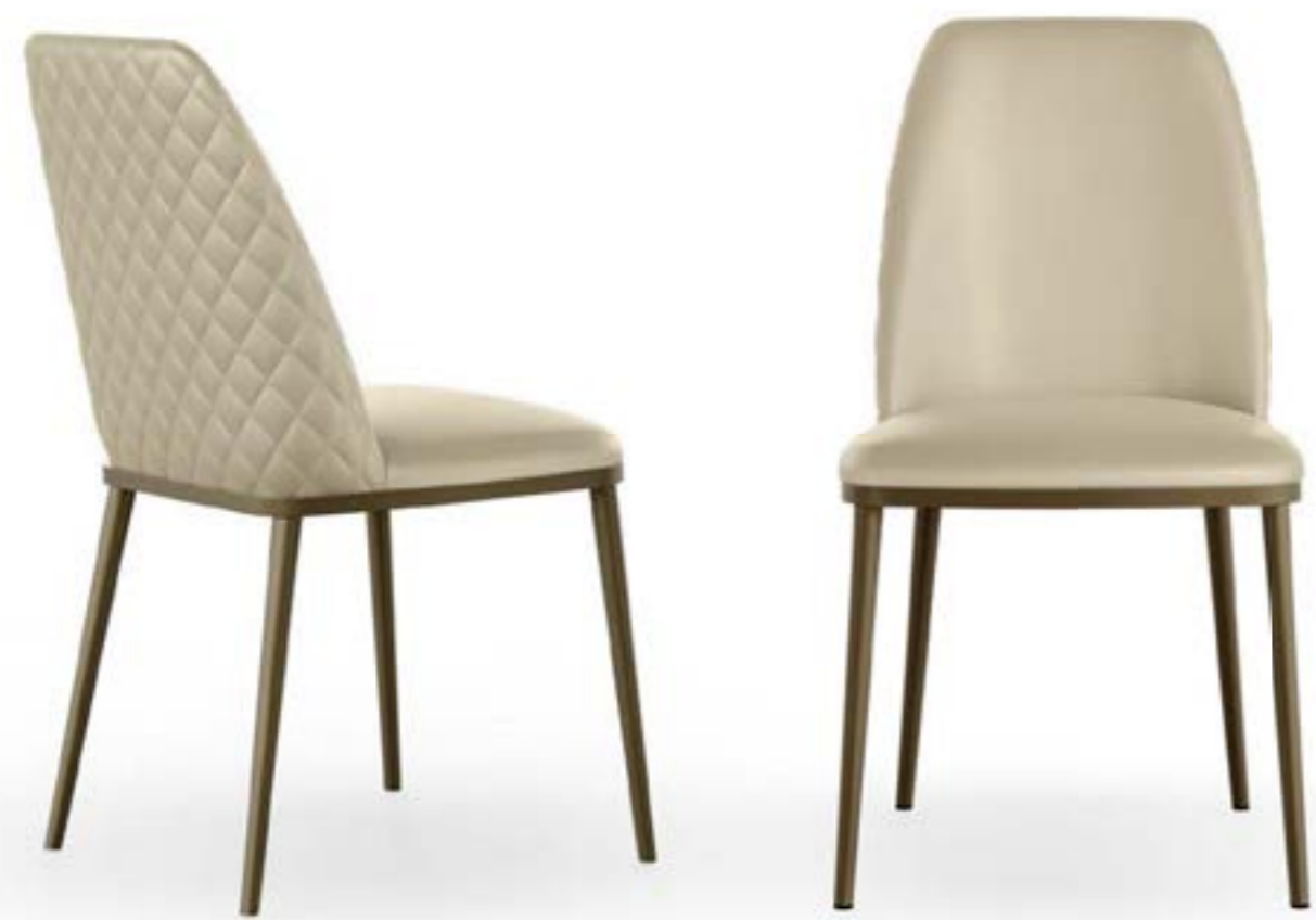
MAX L HIGH DIAMOND_base metallo sedia, base: verniciato bronzo, pelle 5528 beige.