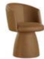
JANE PRESTIGE pag. 100