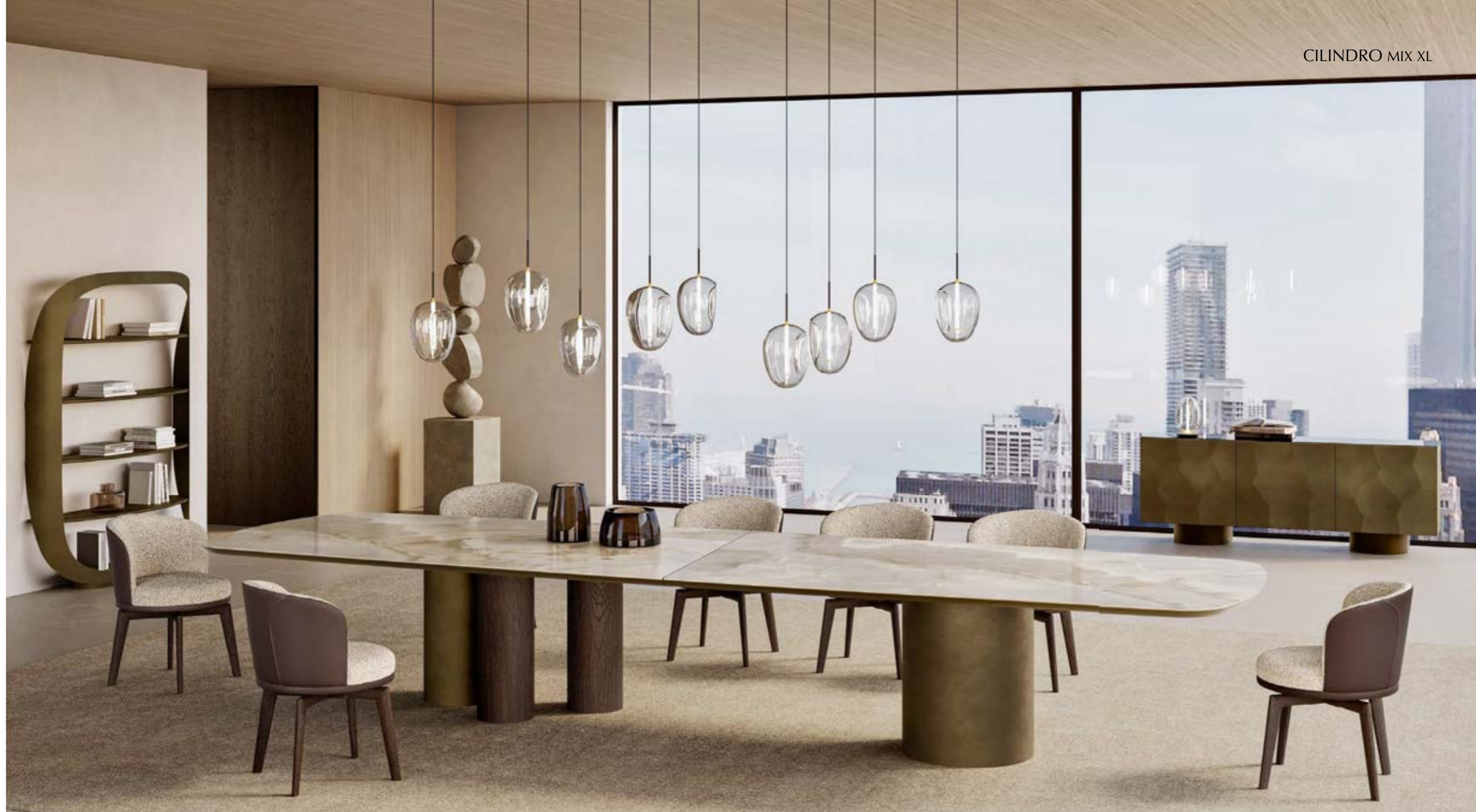
CILINDRO MIX_top ceramica Prime XL tavolo, cm 460x140 sagomato, base: bronzo spazzolato vintage, frassino testa di moro, piano: ceramica Onice bianco lucido. GINGER_trespole legno poltroncina, base: frassino testa di moro, seduta: tessuto A 432, schienale: pelle Elite E28 caffè. FOS_9 sospensione lampada · GRETA madia, versione B, cm 200x48x h 73, bronzo spazzolato vintage, piano: cristallo specchiato bronzo. FOS_tavolo lampada, oro spazzolato · POLIFEMO LIBRERIA, cm 139x35x h 194, bronzo spazzolato vintage.