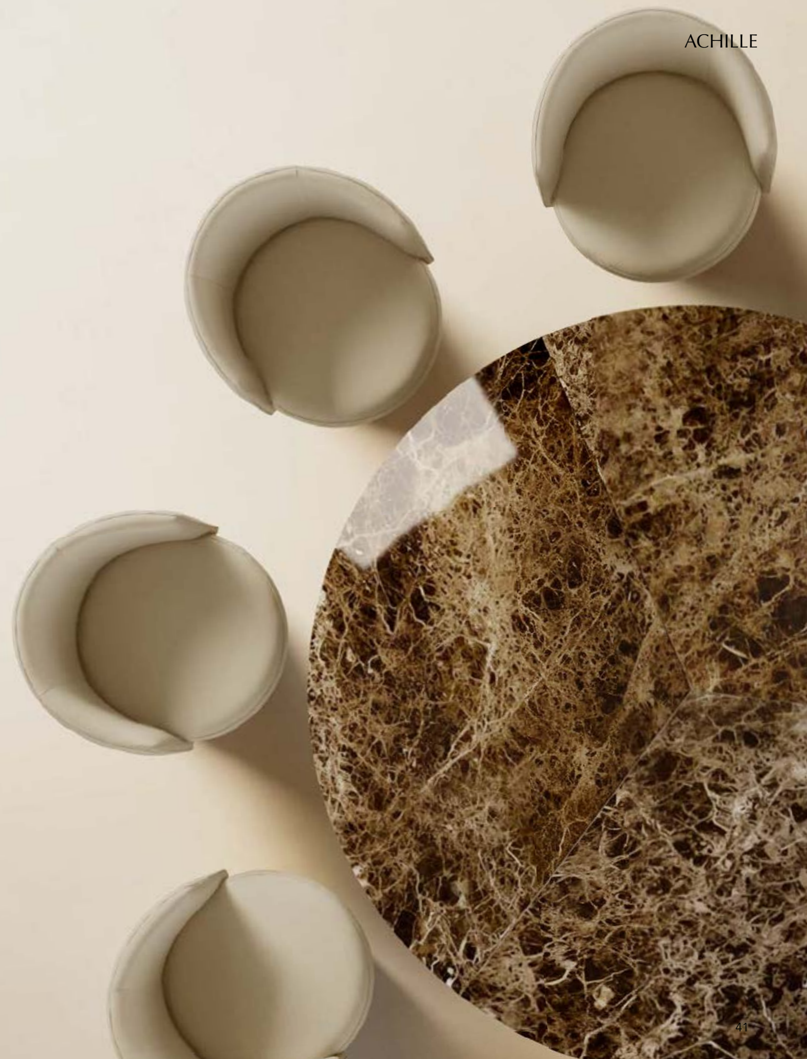
ACHILLE_marble top table, cm Ø 180, base: brushed bronze vintage, top: glossy Emperador marble.