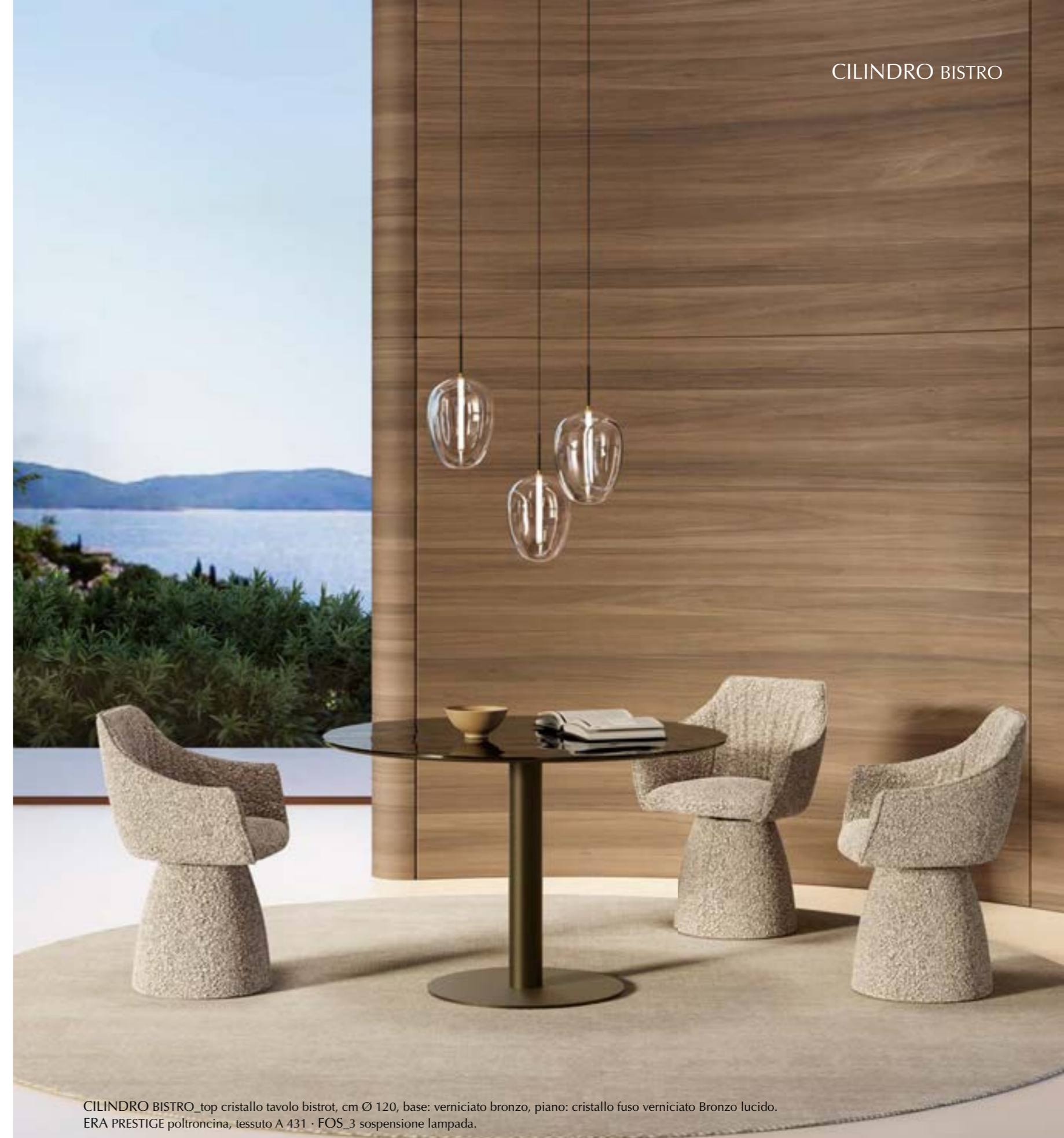
CILINDRO BISTRO_top cristallo tavolo bistrot, cm Ø 120, base: verniciato bronzo, piano: cristallo fuso verniciato Bronzo lucido. ERA PRESTIGE poltroncina, tessuto A 431 · FOS_3 sospensione lampada.

Collection of bistro tables with a refined and essential design, it is the reinterpretation of the typical bar tables of the 70s. The characteristic element is the cylindrical base in painted or bicolored metal. Available with round tops in glass, wood, ceramic or marble. The glass and ceramic versions can be enriched by a precious rounded edge in lacquered wood matching with the metal base.