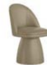
MINNI PRESTIGE pag. 106