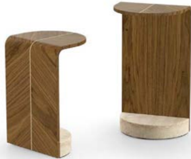
COBRA tavolino, cm h 45, cm h 55, base: marmo travertino, struttura: noce Canaletto.