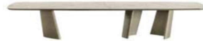
ACHILLE Top XL / XL top pag. 20