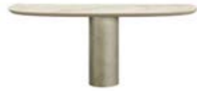
CILINDRO CONSOLE pag. 148