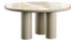
CILINDRO MIX pag. 66