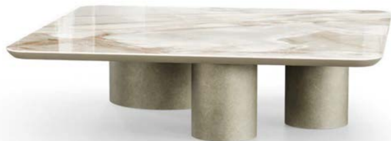
CILINDRO MIX LOW_top ceramica Prime tavolino, cm 140x140x h 35,5, base: platino spazzolato, piano: ceramica Onice bianco lucido.