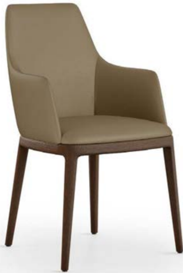
MAX arm HIGH_base legno poltroncina, base: frassino testa di moro, pelle 9034 creta.