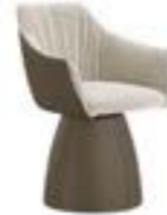
ERA PRESTIGE pag. 94