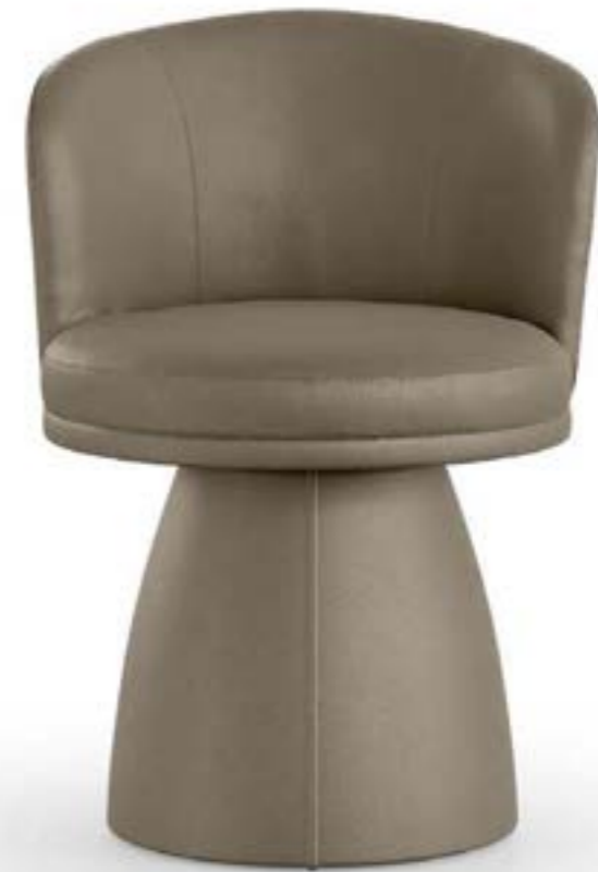
GINGER PRESTIGE poltroncina, pelle 4036 creta scuro.