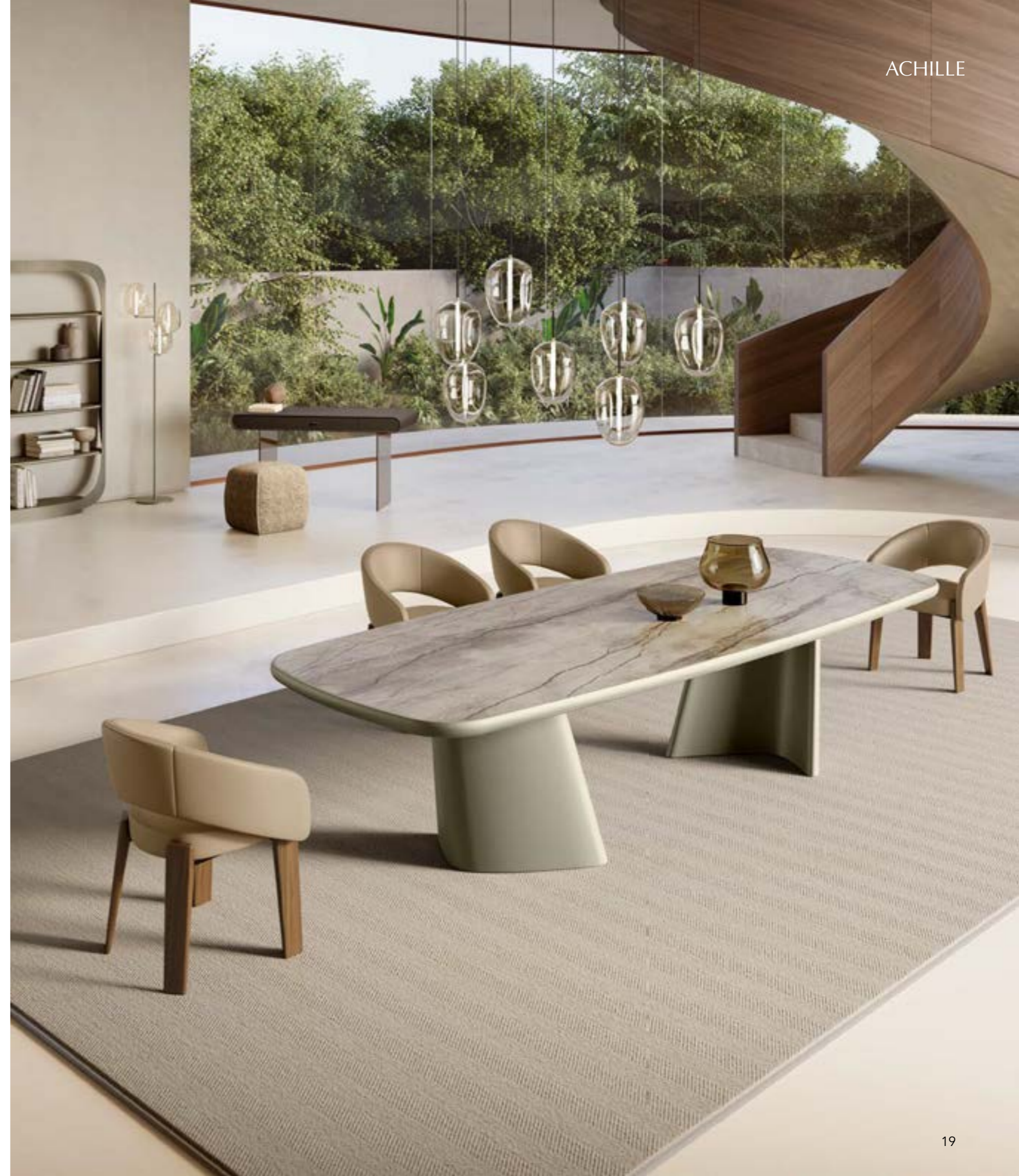
ACHILLE_ceramic top King table, cm 303x123 shaped, base: titanium painted, top: matt ceramic Silver Root, edge: titanium painted. FUR armchair, legs: Canaletto walnut, leather Elite E04 argilla · FOS_7 pendant lamp · POLIFEMO BOOKCASE, cm 139x35x h194, brushed platinum · BICE DESK, base: fumé transparent glass, top: leather 5270 testa di moro. NICO pouf, cm 48x48x h 49, fabric B 292