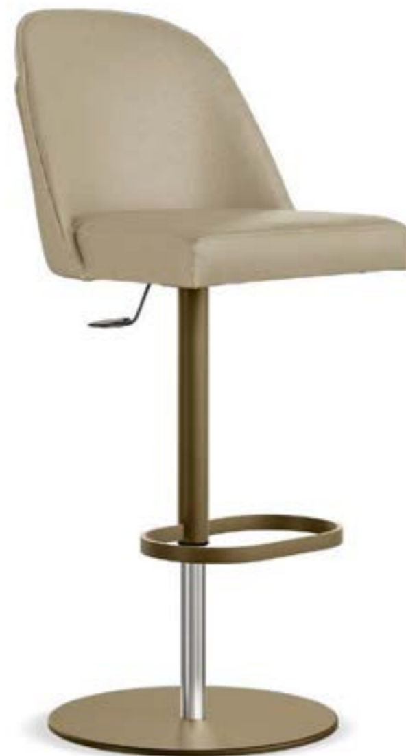
MANTA STOOL_swivel base stool, base: bronze painted, leather Elite E18 smoke.