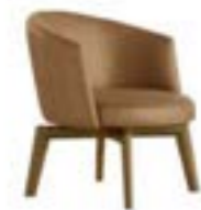
JANE LOUNGE pag. 128