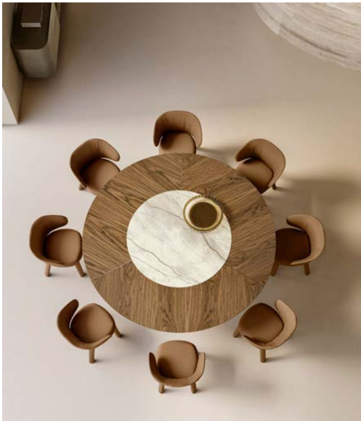
CILINDRO MIX_top legno, ceramica tavolo, cm Ø 220, base: platino spazzolato, noce Canaletto, piano: noce Canaletto, ceramica Silver Root bianco opaco · GUJA arm poltroncina, pelle 4234 tabacco chiaro · FOS_6 sospensione lampada. NINFA madia, cm 200x48x h 74, platino spazzolato.