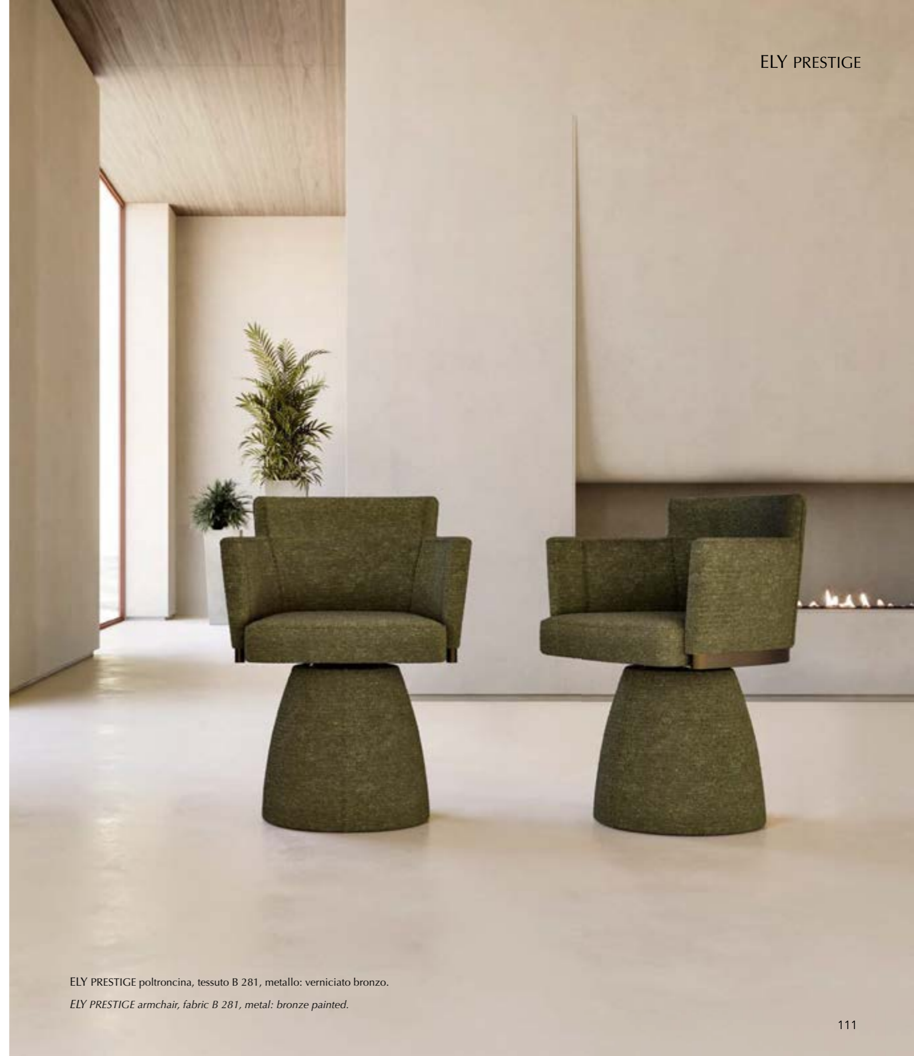
ELY PRESTIGE poltroncina, tessuto B 281, metallo: verniciato bronzo.

Generous upholstered armchair resting on a swivel metal base. Designed for home spaces but also ideal for working environments. The DIAMOND version with a quilted backrest is rich and sophisticated. The version Prestige is characterized by a significant conical base completely upholstered fix or swivel. Available in leather, eco-leather or fabric.