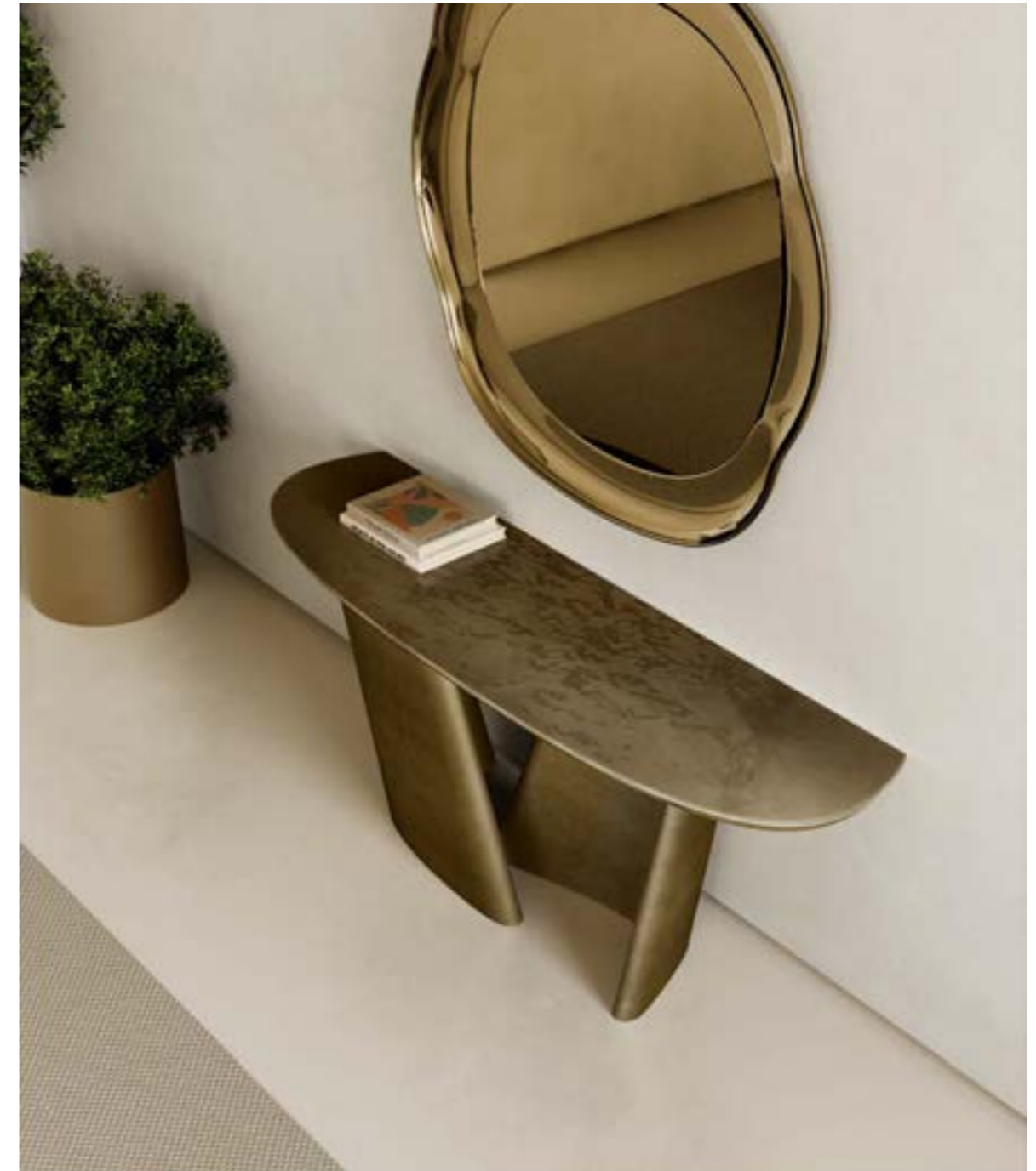
ACHILLE CONSOLE_top cristallo, cm 180x50x h 72, base: bronzo spazzolato vintage, piano: cristallo fuso verniciato Bronzo lucido. MATISSE specchio, cm 120x120, cristallo specchiato bronzo.