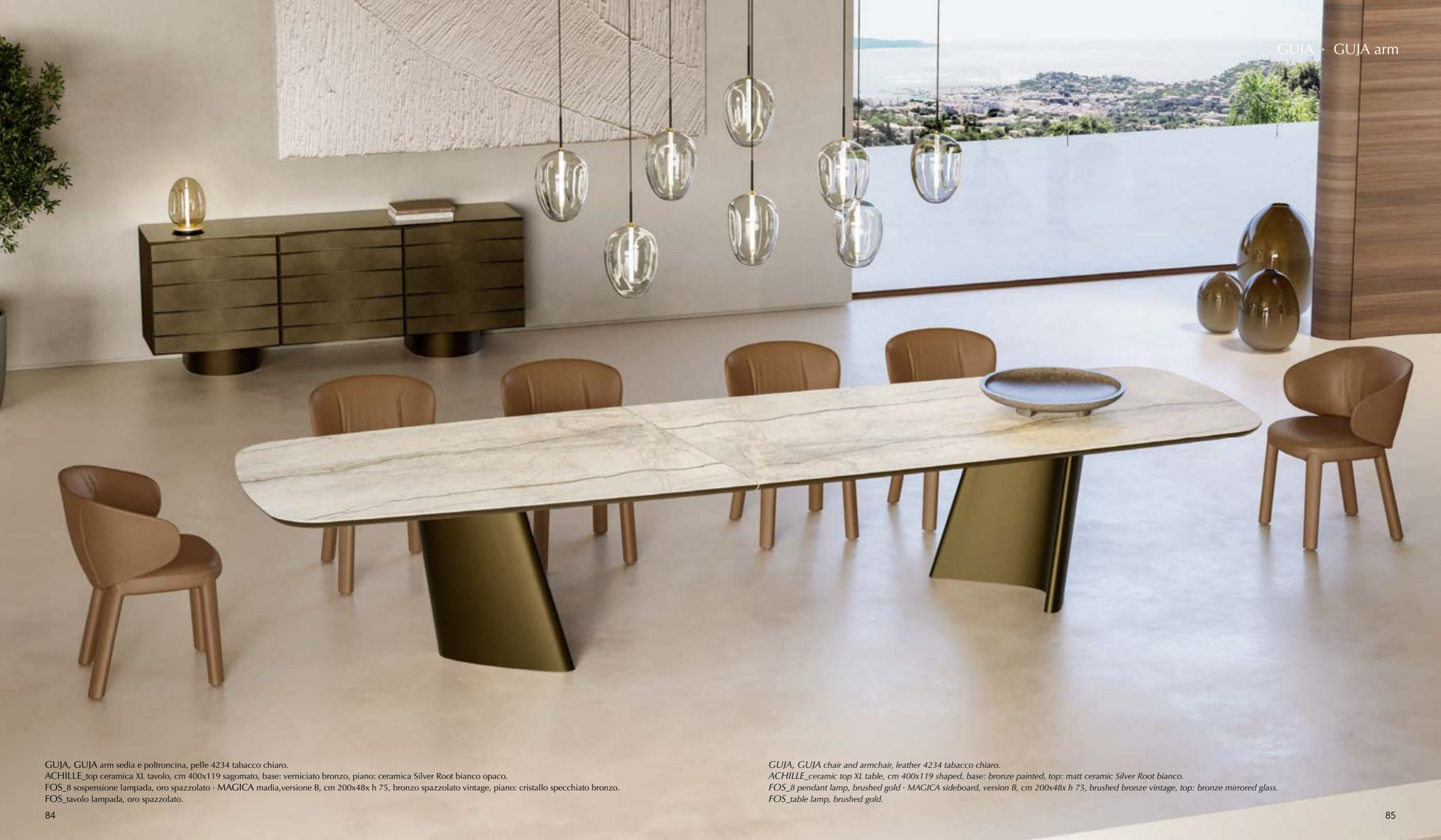
GUJA, GUJA arm sedia e poltroncina, pelle 4234 tabacco chiaro. ACHILLE_top ceramica XL tavolo, cm 400x119 sagomato, base: verniciato bronzo, piano: ceramica Silver Root bianco opaco. FOS_8 sospensione lampada, oro spazzolato · MAGICA madia, versione B, cm 200x48x h 75, bronzo spazzolato vintage, piano: cristallo specchiato bronzo. FOS_tavolo lampada, oro spazzolato.