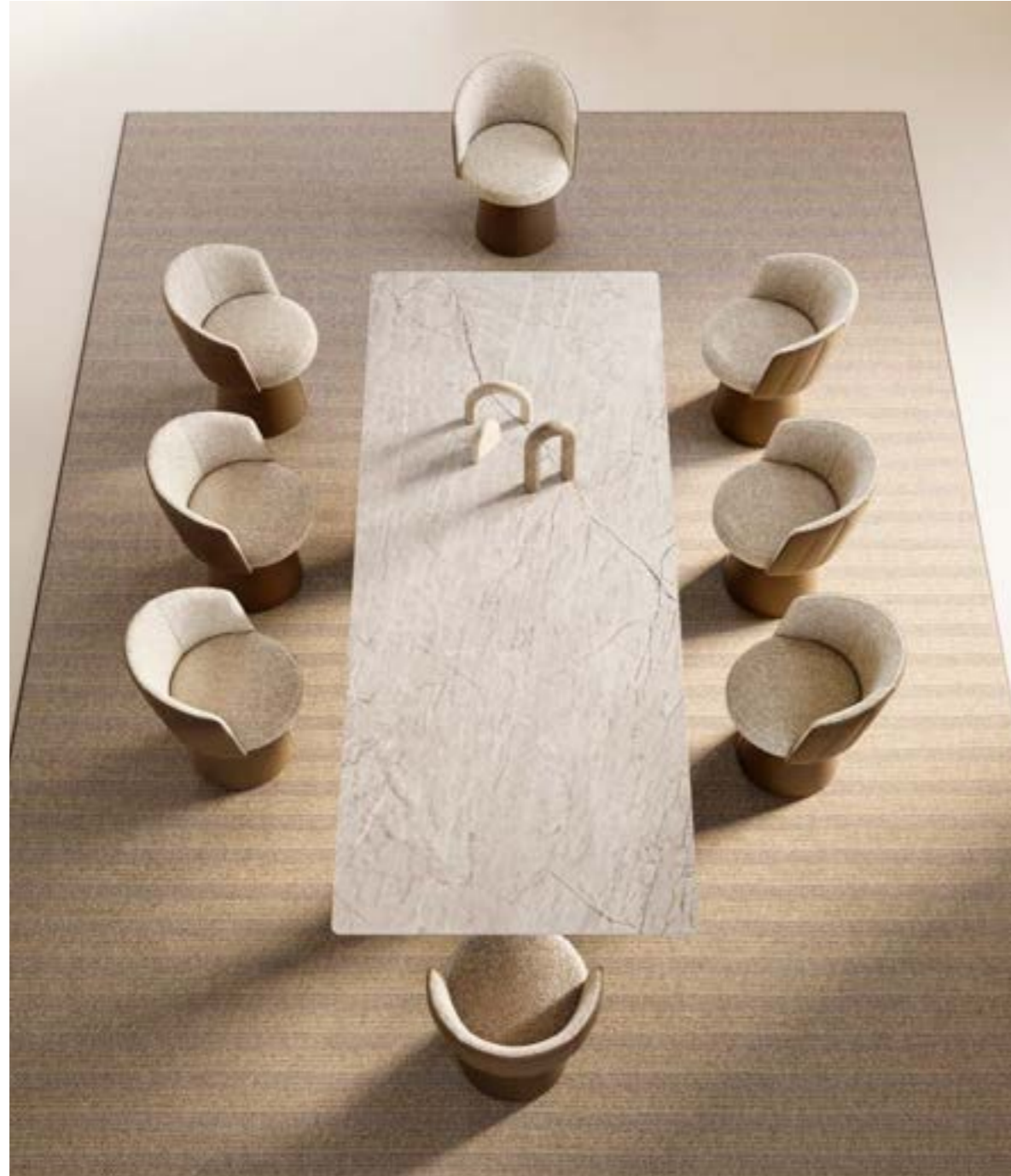
ACHILLE_top ceramica Prime tavolo, cm 300x120, base: bronzo spazzolato vintage, piano: ceramica Mahal Silk. JANE PRESTIGE poltroncina, schienale interno e seduta: tessuto A 432, schienale esterno e base: pelle 4234 tabacco chiaro. DEW_lampada sospensione, oro spazzolato · ACHILLE CONSOLE_top cristallo consolle, cm 180 x50 x h 72, base: bronzo spazzolato vintage, piano: cristallo fuso verniciato bronzo lucido · ASTRUM specchio, cm 132x120, cristallo bronzo specchiato.

ACHILLE ceramic top Prime table, cm 300x120, base: brushed bronze vintage, top: ceramic Mahal Silk. JANE PRESTIGE armchair, internal back and seat : fabric A 432, external back and base: leather 4234 tabacco chiaro. DEW pendant lamp, brushed gold · ACHILLE CONSOLE_glass top console, cm 180x50 xh72, base: brushed bronze vintage, top: glossy Bronze painted fused glass · ASTRUM mirror, cm 132x120, bronze mirrored glass.