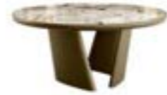
ACHILLE pag. 34