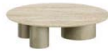
CILINDRO MIX LOW pag. 180