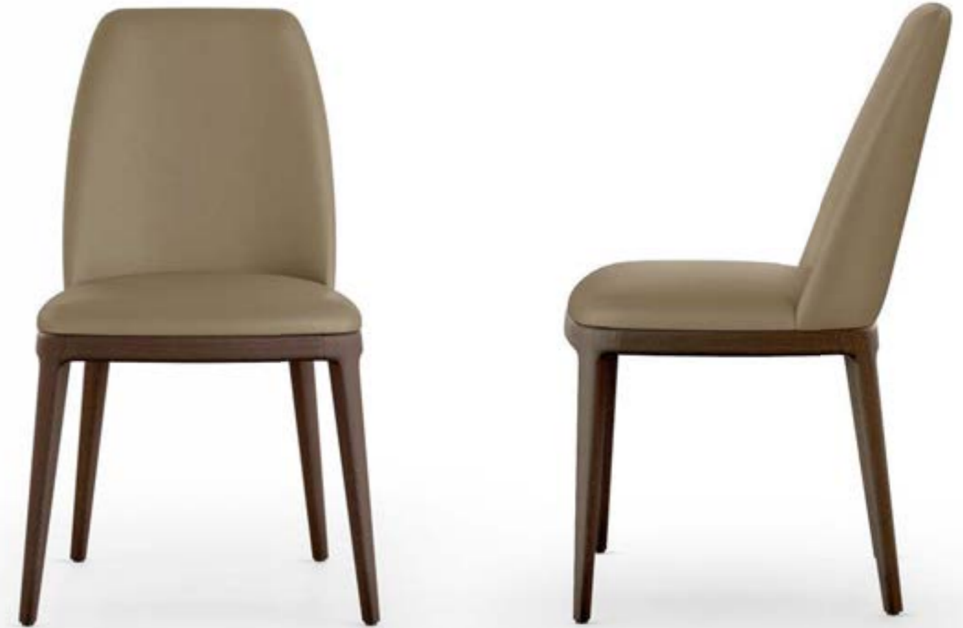
MAX L HIGH_base legno sedia, base: frassino testa di moro, pelle 9034 creta.