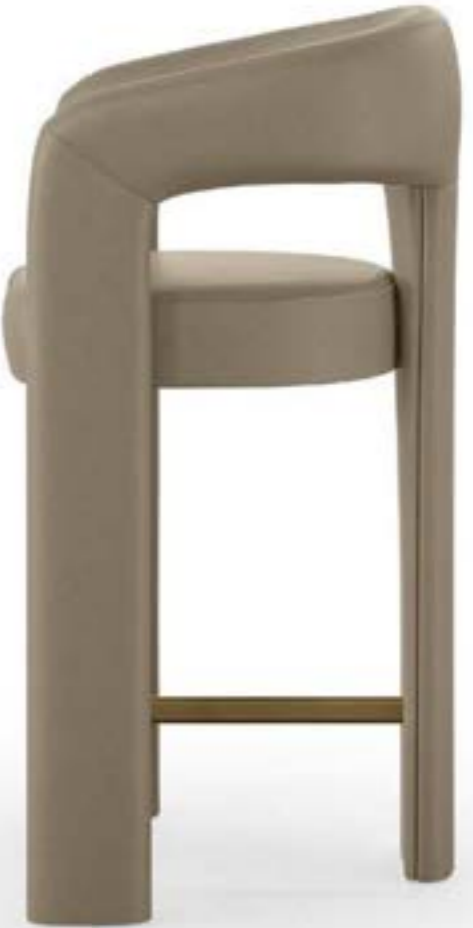
EGLE STOOL h 67 sgabello, leather 4036 creta scuro, poggiatesta: verniciato bronzo.