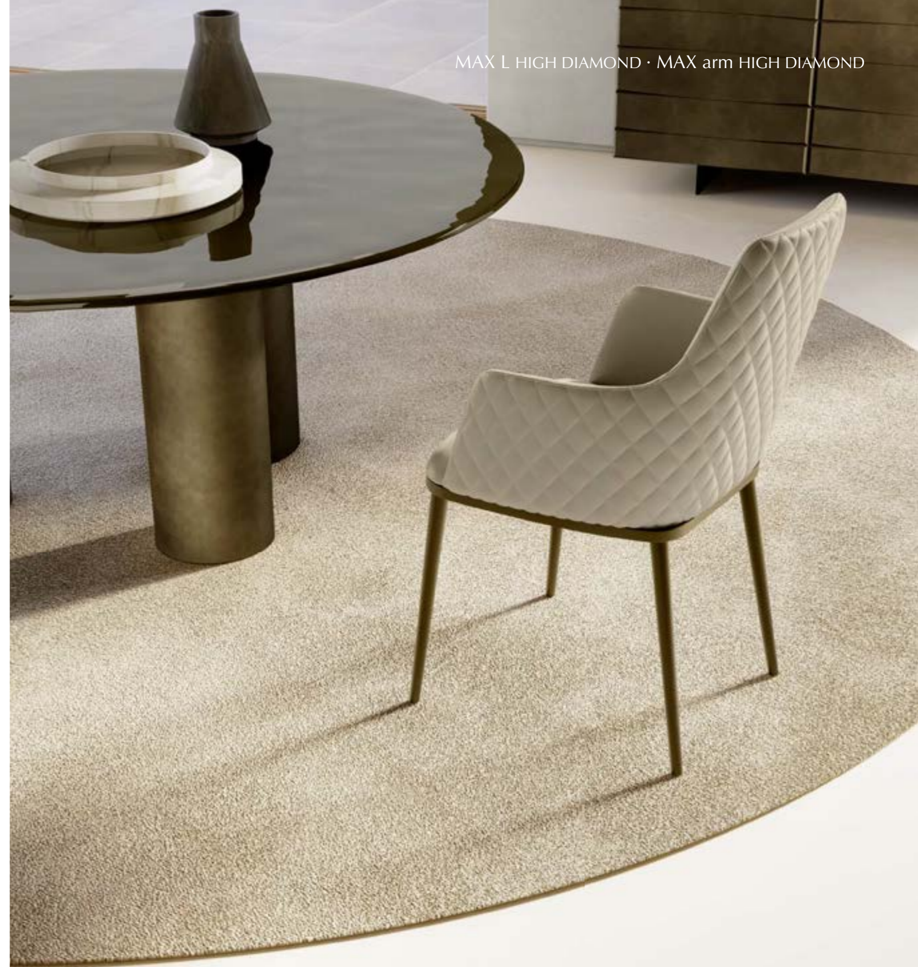
MAX L HIGH DIAMOND · MAX arm HIGH DIAMOND