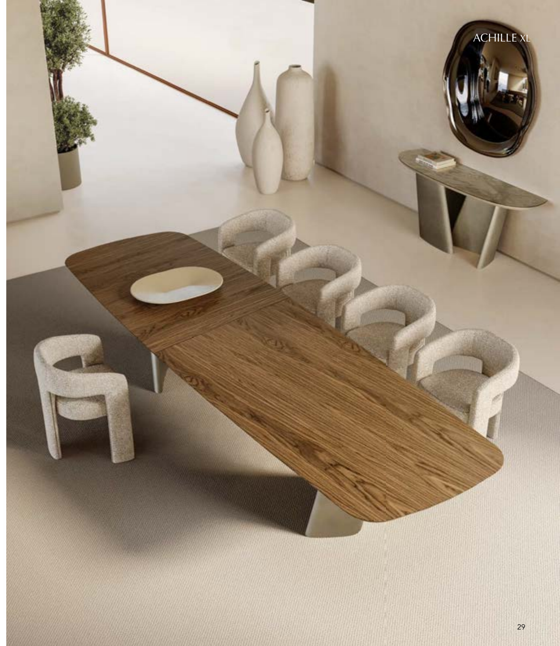
ACHILLE_wood top XL table, cm 400x120 shaped, base: brushed platinum, top: Canaletto walnut · EGLE armchair, fabric A 432. ACHILLE CONSOLE_glass top console, cm 180x50x h 72, base: brushed platinum, top: glossy Tortora painted fused glass. MATISSE mirror, cm 120x120, mirrored glass.