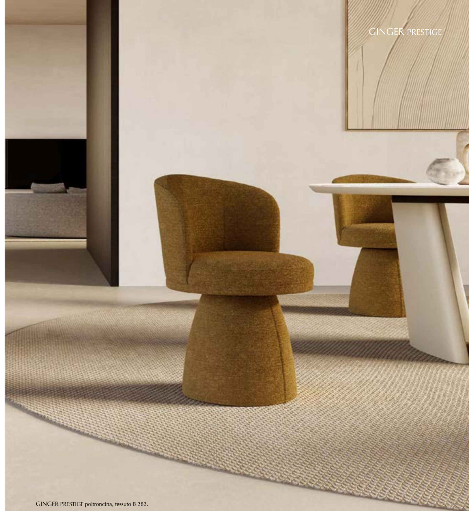
GINGER PRESTIGE poltroncina, tessuto B 282.