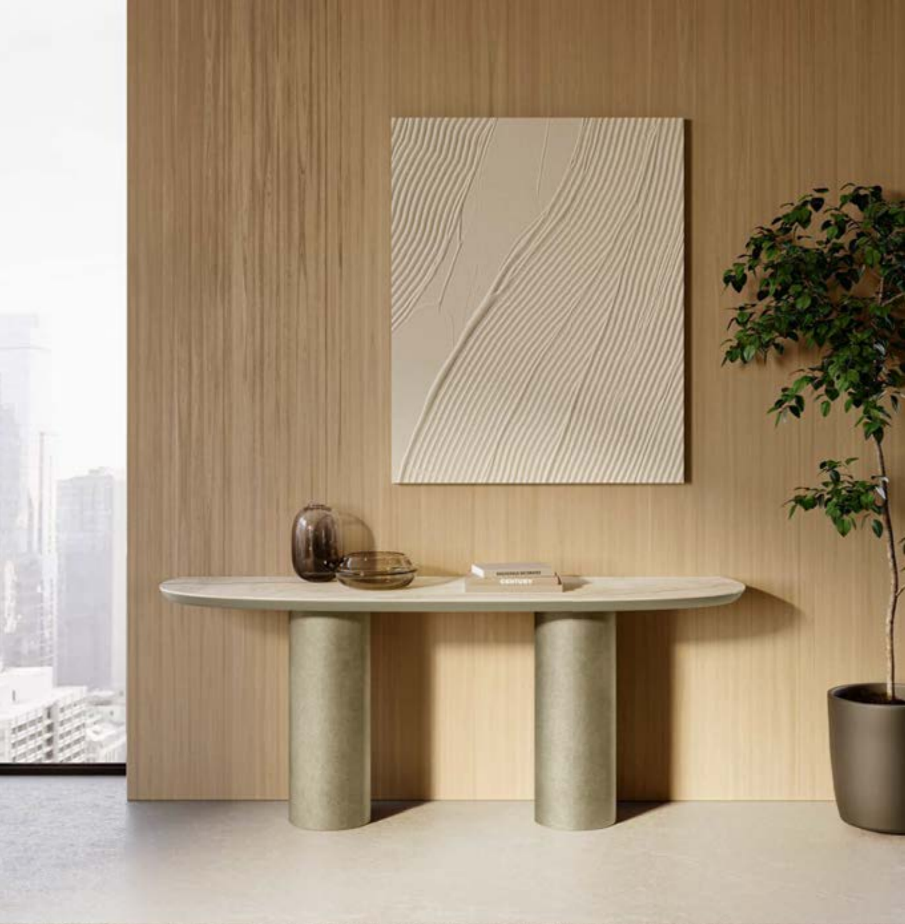
CILINDRO DUO CONSOLE_top ceramica, cm 180x50x h 72, base: platino spazzolato, piano: ceramica Silver Root bianco opaco.