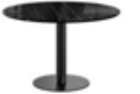
CILINDRO BISTRO pag. 78