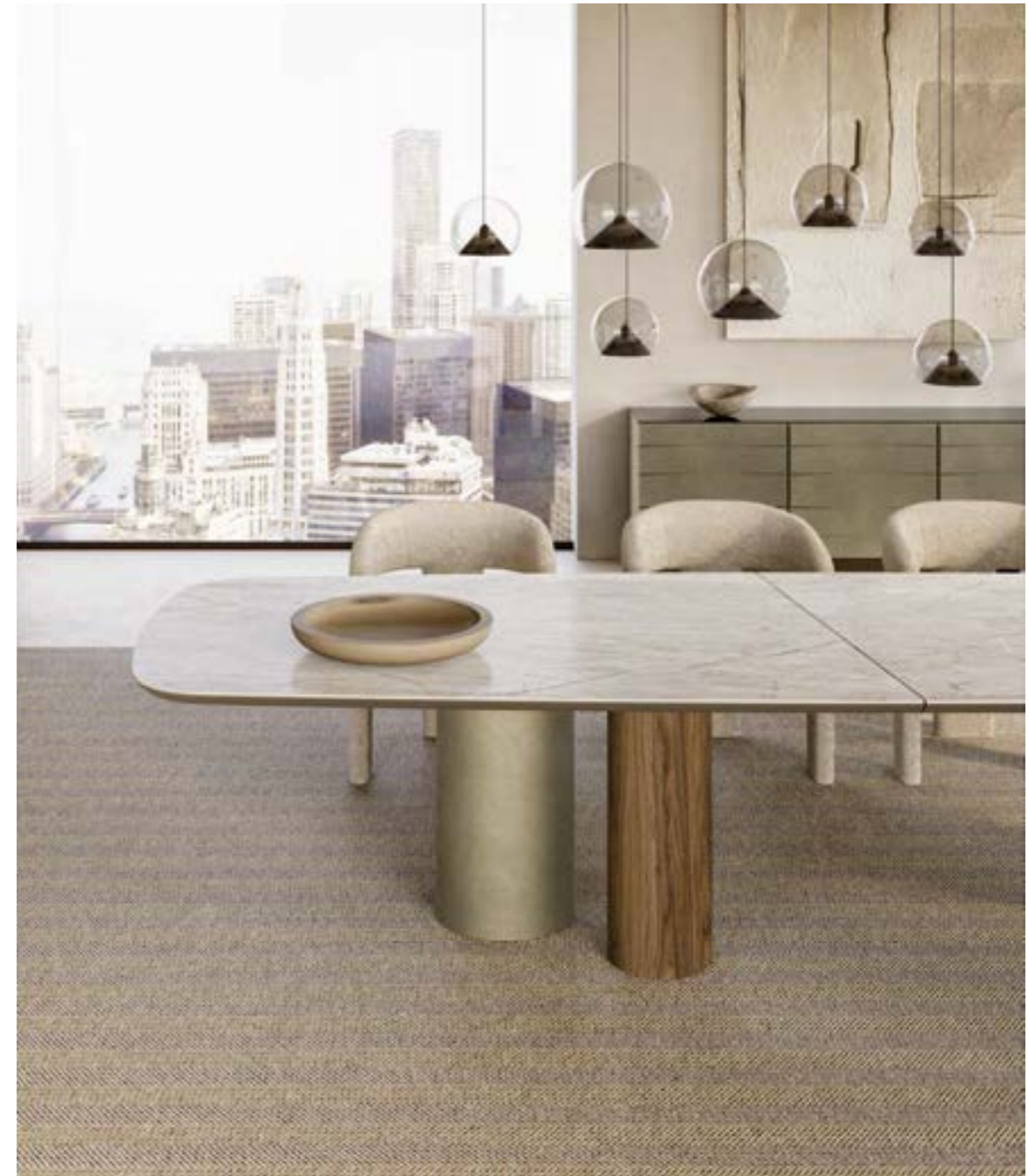
CILINDRO MIX_top ceramica Prime XL tavolo, cm 400x119 sagomato, base: platino spazzolato, noce Canaletto, piano: ceramica Mahal Silk · EGLE poltroncina, tessuto B 280 · CHERRY MIX_12 sospensione lampada, verniciato nero. CILINDRO CONSOLE_top ceramica consolle, cm 180x50x h 72, base: platino spazzolato, piano: ceramica Mahal Silk. GALLERY specchio, cm 132x122, cristallo specchiato fumè.