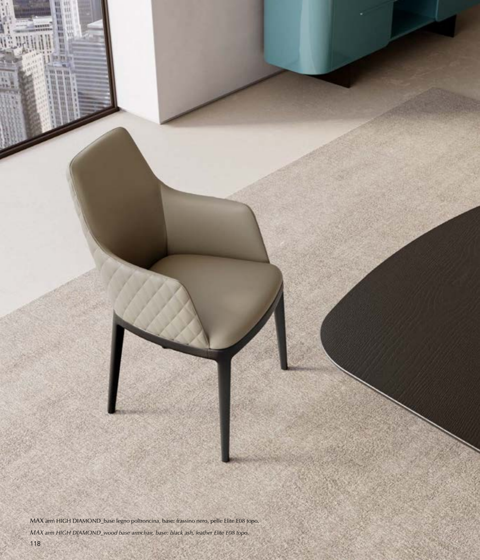
MAX arm HIGH DIAMOND_base legno poltroncina, base: frassino nero, pelle Elite E08 topo.