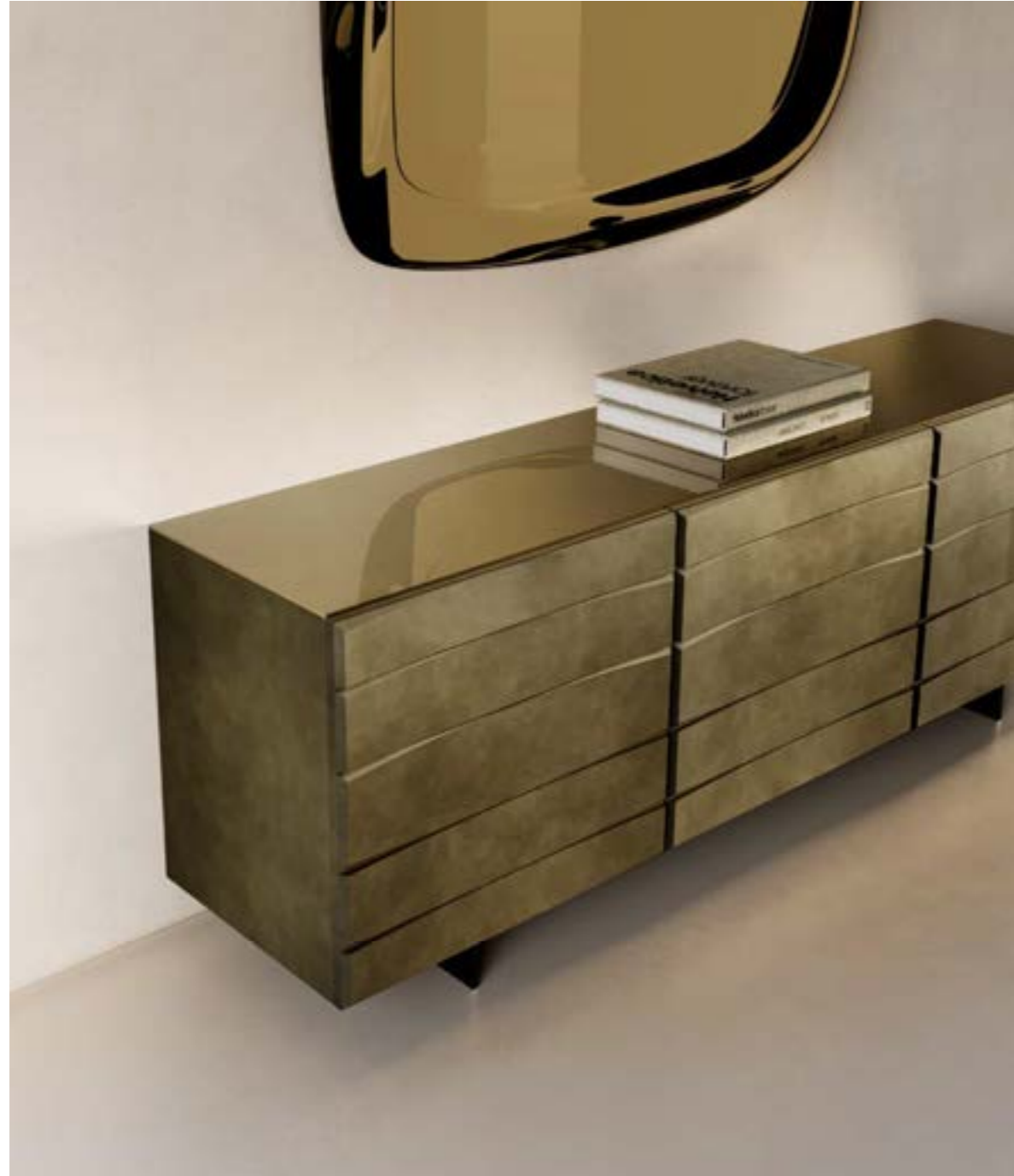
MAGICA madia, versione A, cm 200x48x h 75, bronzo spazzolato vintage, top: cristallo specchiato bronzo.