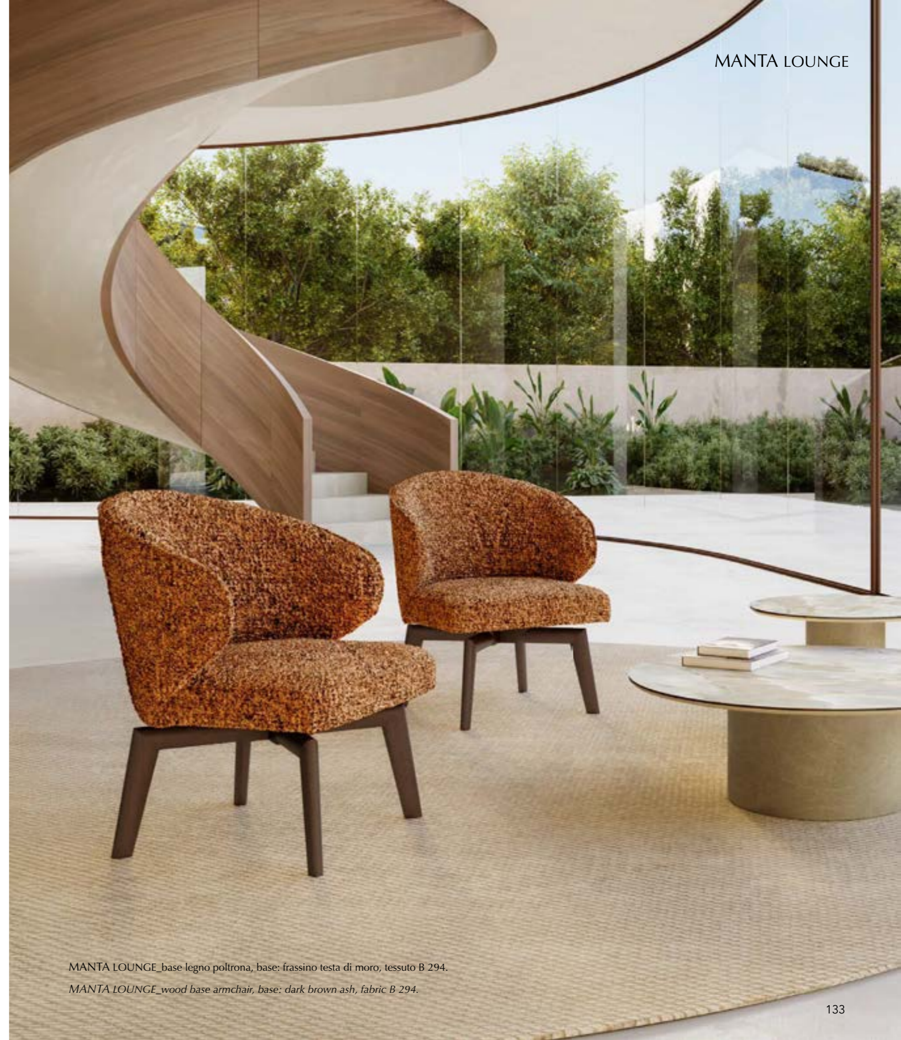
MANTA LOUNGE_base legno poltrona, base: frassino testa di moro, tessuto B 294.

Armchair deriving from the Manta armchair. The deep sartorial care is highlighted by important details in the upholstery that enhance the excellent craftsmanship of the manufacture. Ideal for residential interiors but also suitable for work spaces. It has a aluminium swivel central base or wood base swivel. Available in leather, eco-leather or fabric.