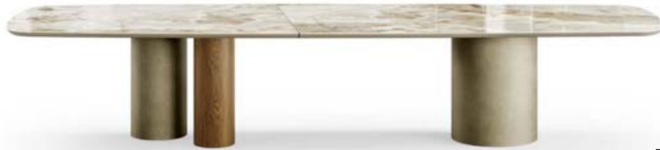
CILINDRO MIX_top ceramica Prime XL tavolo, cm 400x119 sagomato, base: platino spazzolato, noce Canaletto piano: ceramica Onice lucido. CILINDRO MIX_ceramic top Prime XL table, cm 400x119 shaped, base: brushed platinum, top: glossy ceramic Onice.