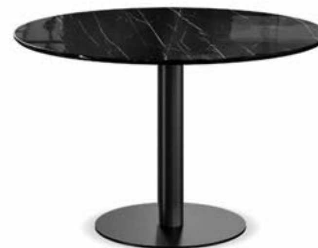
CILINDRO BISTRO_top marmo tavolo bistrot, cm Ø 120, base: verniciato nero, piano: marmo Nero Marquina lucido.