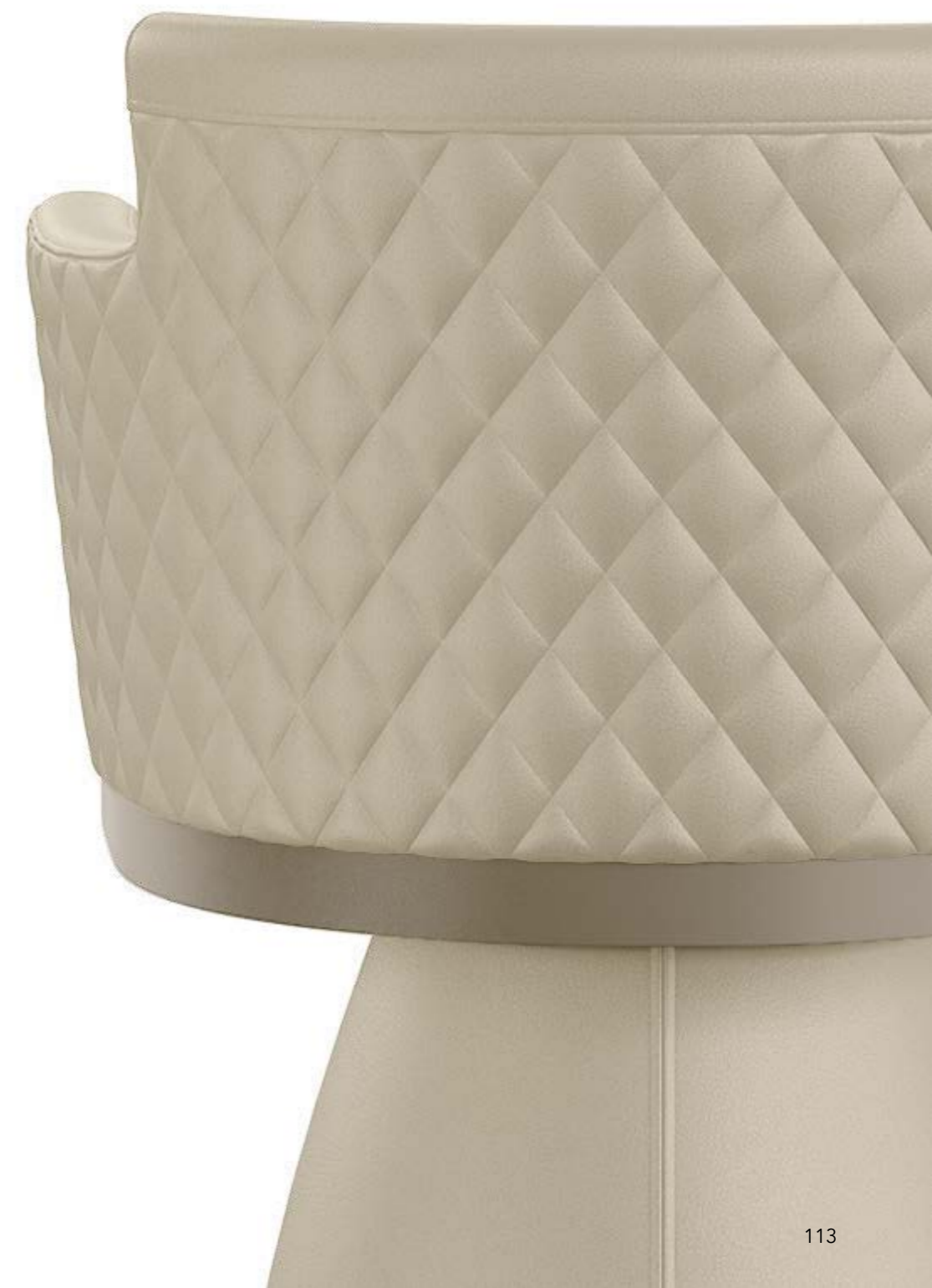
ELY PRESTIGE DIAMOND poltroncina, pelle 4548 beige chiaro, metallo: verniciato titanio.