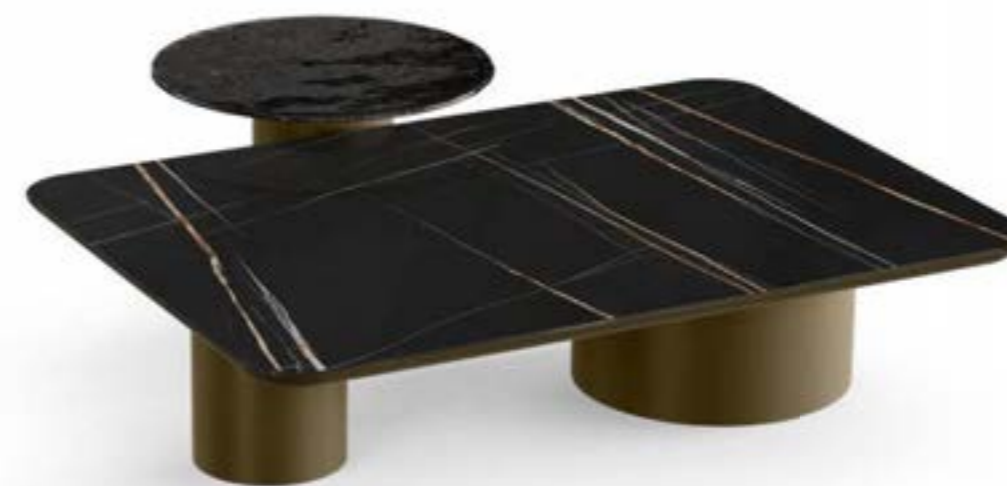
CILINDRO MIX LOW_top ceramica Prime tavolino, cm 140x100x h 35,5, base: verniciato bronzo, piano: ceramica Sahara Noir lucido. CILINDRO LOW_top cristallo tavolino, Ø cm 60x h 42, base: verniciato bronzo, piano: cristallo fuso verniciato Nero lucido.