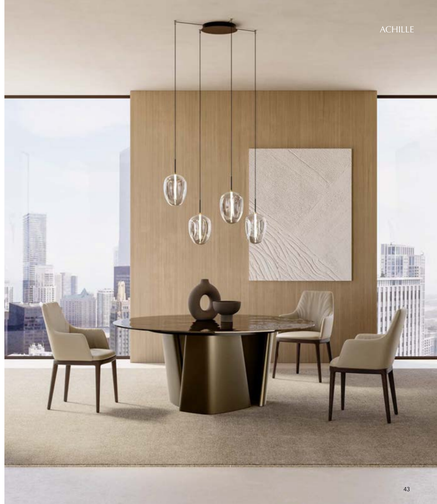
ACHILLE_glass top table, cm Ø 180, base: bronze painted, top: glossy Bronze painted fused glass. MAX arm HIGH DELUXE_wood base armchair, base: dark brown ash, leather Elite E18 smoke. FOS_4 pendant lamp.