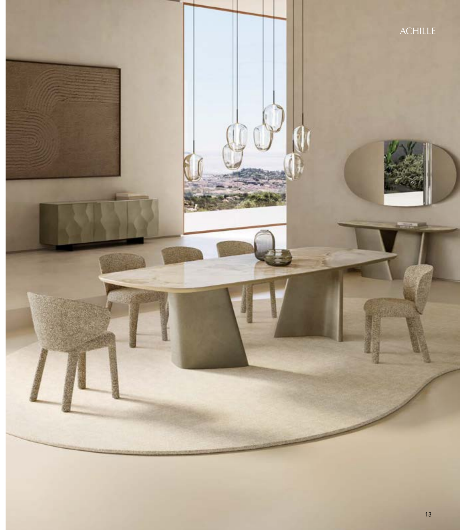
ACHILLE_ceramic top Prime table, cm 300x120 shaped, base: brushed platinum, top: glossy ceramic Onice bianco. GUJA, GUJA arm chair and armchair, fabric A 434 · FOS_7 pendant lamp. GRETA sideboard, version A, cm 200x48 x h 73, brushed platinum, top: fumè mirrored glass. ACHILLE CONSOLE_ceramic top console, cm 180x50 xh72, base: brushed platinum, top: glossy ceramic Onice bianco. LET mirror, cm 180x 90, mirrored glass.